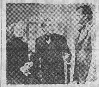
C. E. A. presentará "Una nación en marcha" creación de José MacCrea

INGENIEROS DE CAMINOS Las clases han empezado el 15 de septiembre SERRANO, 50 TELÉFONO 54663 (4225 A)