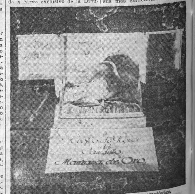
Premio de honor de la última Exposición pomológica

El celo creciente que en esta magnífica obra pone la Corporación Provincial, le ha llevado a tener ya en preparación los límites para los consorcios con los Ayuntamientos de Salas, Tineo y Cabranes, para la repoblación de los montes comunales de estos términos, calculándose que se repoblarán ya terrenos para este objeto por unas 1.800 hectáreas, aproximadamente. Sin embargo, por las razones anteriormente expuestas, bajo el pretexto de la necesidad de pastos y explotación de rozo continúa en suspenso la repoblación de Las Reñeras, ya habiéndose realizado ya las obras pertinentes en varios montes, aportando los terrenos a repoblar los Ayuntamientos y el Patrimonio Forestal del Estado y la Diputación, por partes iguales, todos los gastos de repoblación, conservación y guardería, y corriendo a cargo exclusivo de la Dipu-