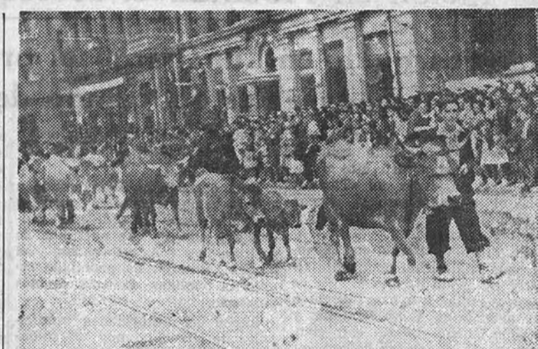
Desfile de ejemplares premiados en la última Exposición de ganados

La segunda Exposición Pomológica Provincial, ha servido pa-