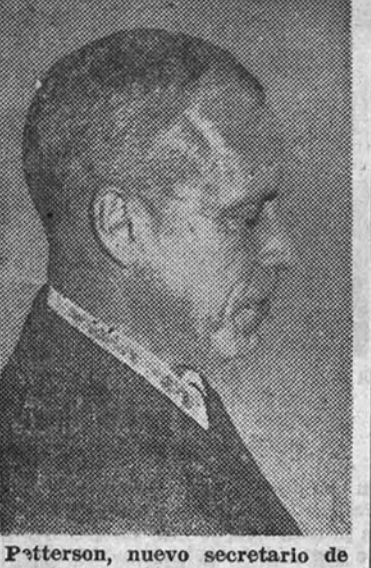
Patterson, nuevo secretario de Guerra

LE SUSTITUYE EL QUE ERA SUBSECRETARIO DEL MISMO DEPARTAMENTO