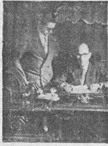
El camarada Solano Costa, Gobernador Civil y Jefe Provincial del Movimiento de Asturias

Una intensa producción, en proporción con su capacidad, es el fruto de tales esfuerzos, con 625.000 toneladas de producción mensual y otras 14.000 de antracita en el mismo período. A pesar de la crisis sufrida, en lo que