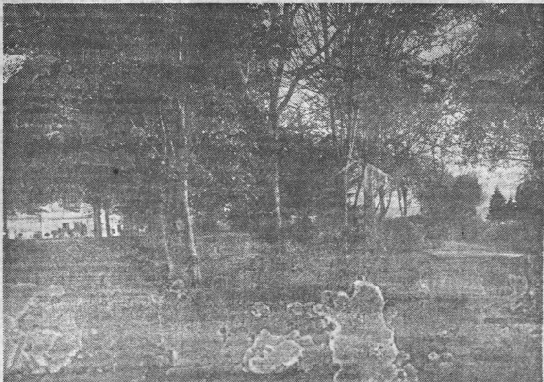
Hogar Escolar Gudalupes (Colombres): Detalle de los jardines