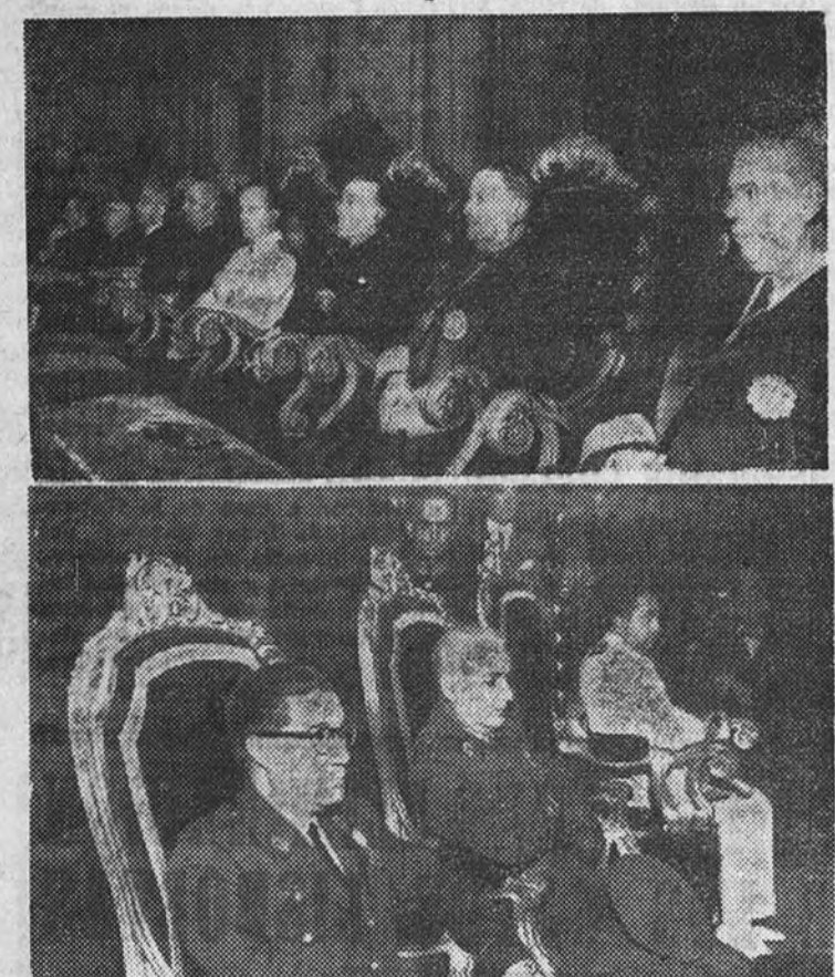
Los Ministros de Justicia, Aire y Obras Públicas, con los altos magistrados, presiden las solemnes exequias por el alma del que fué presidente del Tribunal Supremo don Felipe Clemente de Diego, celebradas en la iglesia de Santa Bárbara.

Fueron presididas por el Ministro de Justicia, al que acompañaban los presidentes de Sala del Supremo