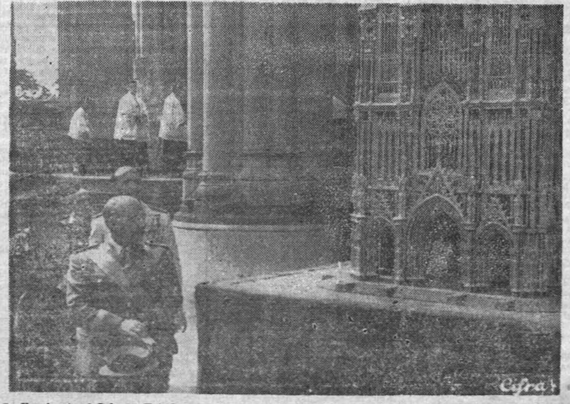
Su Excelencia el Jefe del Estado y su esposa contemplan la maqueta de la nueva catedral de Vitoria

Relación de barcos llegados a puertos nacionales: «Eolo», a Barcelona, el día 8 del actual, con 7.124 toneladas de trigo. «Monte Teide», a Alicante, el día 9 del actual, con 9.109 toneladas de trigo. «Castillo Ampudia», a Canarias, el día 9 del actual, con 4.300 toneladas de maíz. «Monte Oliz», a Málaga, el día 10 del actual, con 7.962 toneladas de trigo.