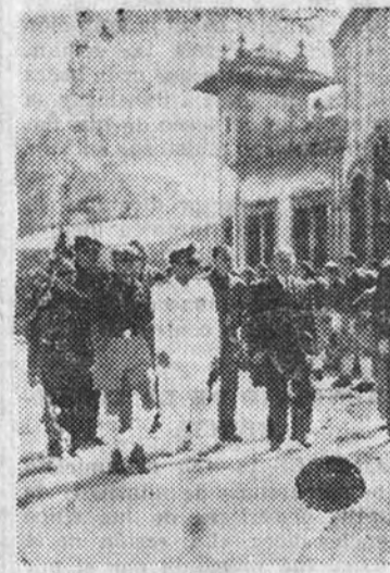
El Jefe Provincial pasa revista a las Falanges Juveniles de Franco

Cualquier desgracia en una mina o un accidente, por pequeño que sea, en el mar, que apenas ocupa