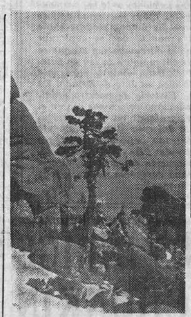
Obra Sindical de Educación y Descanso construye otro, los dos, por debajo de la línea de la carretera que corona el Puerto mirando hacia la hoya de la estación del funicular. Por cierto que también la R. E. N. F. E. se ha sentido obligada a ponerse a tono con el ambiente y ha construido una estación, siguiendo también esos racionales estilos de construcción alpina.