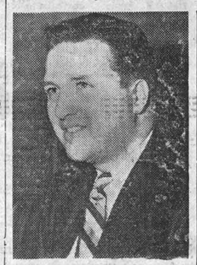
Henry Ford (nieto)

El fundador de la dinastía, que se retiró en 1918, volvió a la dirección en 1943