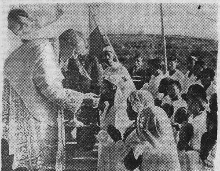
Un grupo de pequeños indios recibe la primera comunión

Cada año, con motivo de la celebración del Domingo Mundial de la Propagación de la Fe, renace con más fuerza en nuestra Patria el espíritu misionero, que la llevó en otro tiempo a la conquista y evangelización del Nuevo Mundo y a ser de las primeras naciones civilizadas que enviaba sus sacerdotes y religiosos por todos los lugares de la tierra para enseñar la doctrina de Cristo. España es, y lo ha sido siempre, una nación esencialmente misionera. Pero si en esto podemos contar muchos años de verdadero esplendor, no podemos conformarnos hoy con el orgullo de aquellas proezas de orden espiritual, y menos cuando toda la cristiandad se prepara para celebrar la jornada universal del "Domund", a la que debemos aportar nuestro fervor y entusiasmo, ya que en la presente hora del mundo España vuelve a ser el más firme puntal de la Iglesia Católica.