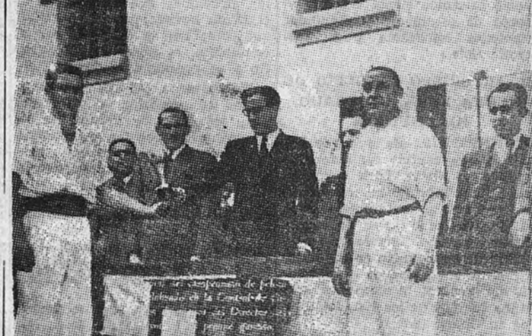
Los ganadores del Campeonato de pelota a mano

Hay granjas avícolas y hortícolas en las siguientes prisiones: Mujeres de Barcelona, Prisión Central de Burgos, Puerto de Santa María, Prisión de Mujeres de Ventas (Madrid), Alcalá de Henares, Dueso, Prisión Sanatorio de Cuéllar y Reformatorio de Ocaña. Finalmente se han instalado Escuelas de Capacitación Profesional en Alcalá de Henares, la del padre Pérez del Pulgar, y en Yeserías, con matrícula muy nutrida y resultados muy halagadores. Esta es, en su quinta visión periodística, la labor que el Gobierno de Franco, por medio de la Dirección General de Prisiones, ha realizado. Que nuestros detractores visiten las cárceles españolas, que comprueben los datos, que examinen la legislación penitenciaria, que se informen del espíritu de justicia y caridad que han presidido las sanciones impuestas.