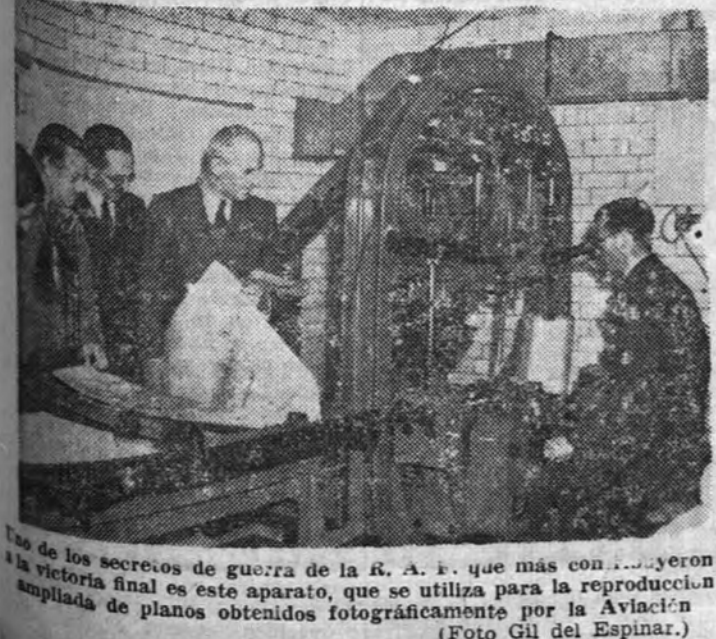
Uno de los secretos de guerra de la R. A. E. que más han ayudado a la victoria final es este aparato, que se utiliza para la reproducción ampliada de planos obtenidos fotográficamente por la Aviación.