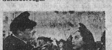
Momento escénico de "El amor en onda corta", que se estrenará en el Callao

Las voces de los artistas de la radio son bien conocidas en sus respectivos países; pero ¿cómo son ellos físicamente? Los radioescuchas sienten deseos de conocerlos, de ver sus tipos. Y éste es uno de los motivos que inspiran "El amor en onda corta". El argumento es divertidoísimo. Se trata de la rivalidad entre artistas de dos estaciones de radio inglesa. Bebe Daniels pertenece a una de ellas y Ben Lyon, su marido en la vida real, y un galán de cine muy notable, pertenece a la otra. "El amor en onda corta" es una graciosa producción de la marca inglesa Gainsborough.