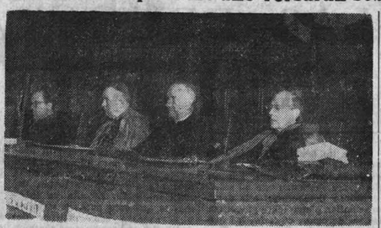
Los obispos de Madrid-Alcalá, Málaga y Menorca presidiendo la última sesión de las dos Semanas de Estudios Superiores Eclesiásticos, que terminaron ayer. (Información en segunda página.)