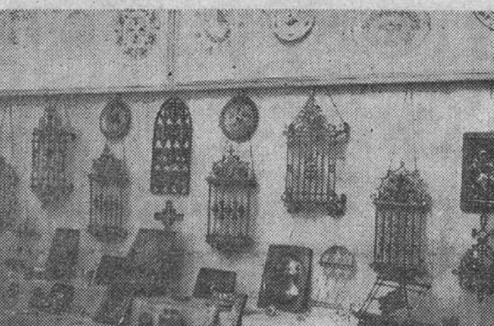
Un detalle de la sala en la que se exponen trabajos de forja y cerrajería artística.

Hoy, a las doce, tendrá lugar, con asistencia de altas jerarquías del Estado, la solemne inauguración de la Exposición nacional de trabajos realizados por los alumnos de las Escuelas de Artes y Oficios Artísticos y Elementales de Trabajo de toda España. Por primera vez, en la ya larga historia de estos Centros de enseñanza profesional y técnica, las realizaciones del alumnado que allí cursa sus estudios han trascendido sus clásicos límites locales y provinciales, para agruparse dentro de la consiguiente amplitud de un certamen de carácter nacional, enmarcado en el Palacio de Exposiciones del Retiro madrileño. Pretende con ello el Ministerio de Educación Nacional—organizador de este acontecimiento—estimular el noble espíritu de constante superación que anima en el profesorado de dichas Escuelas y someter a la consideración de los visitantes del certamen el primer y la exactitud de unos miles de trabajos salidos de las manos de unos muchachos que día tras día reciben la solícita asistencia de un Estado consciente de su alta función educadora.