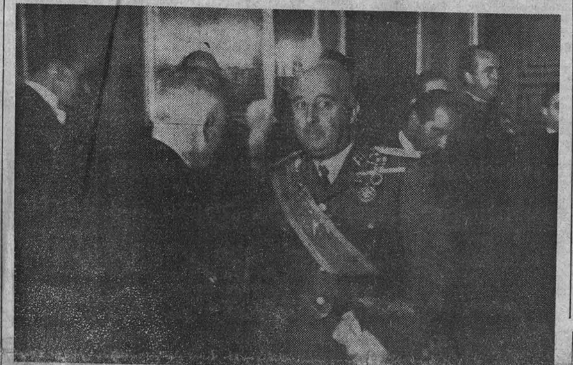
Su Excelencia el Jefe del Estado, durante la recepción celebrada en El Pardo, saluda al Cuerpo diplomático

RECEPCION EN EL PALACIO DE ORIENTE. A las doce de la mañana de ayer se celebró en el Palacio de Oriente la acostumbrada recepción con motivo del noveno aniversario de la exaltación del Generalísimo a la Jefatura del Estado.