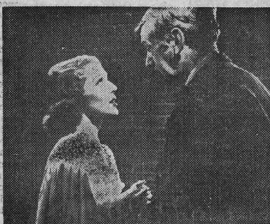
"EL HOMBRE QUE VENDIÓ SU ALMA"

El éxito clamoroso y rotundo de su estreno tuvo repercusiones en la Prensa de toda España, en la que las plumas más ilustres hicieron la exégesis de esta superproducción y sacaron toda clase de consecuencias desde los diferentes puntos de su enjuiciamiento. "El hombre que vendió su alma" va a reestrenarse en el suntuoso Cinema Bilbao, que, siguiendo su norma de dar a conocer las mejores películas, no duda en mostrar a su público (público de temporada) las dogmas modernísimas de esta superproducción presentada por Astoria, que marca un hito en la cinematografía universal.