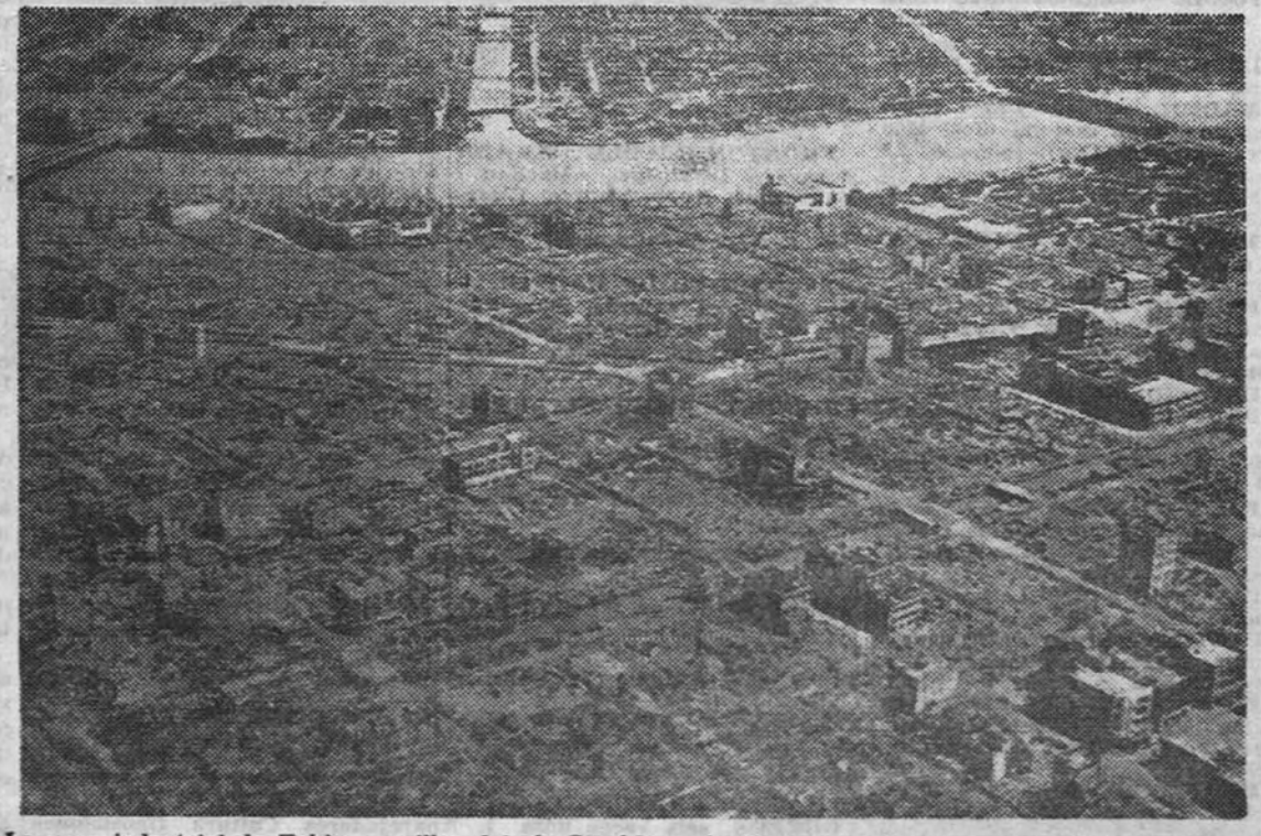
La zona industrial de Tokio, a orillas del río Sumida, reducida a escombros a consecuencia de los repetidos bombardeos de la Aviación americana durante las últimas semanas de la contienda universal.