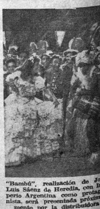
"Bambú", realización de José Luis Sáenz de Heredia, con Imperio Argentina como protagonista, será presentada próximamente por la distribuidora Ballesteros