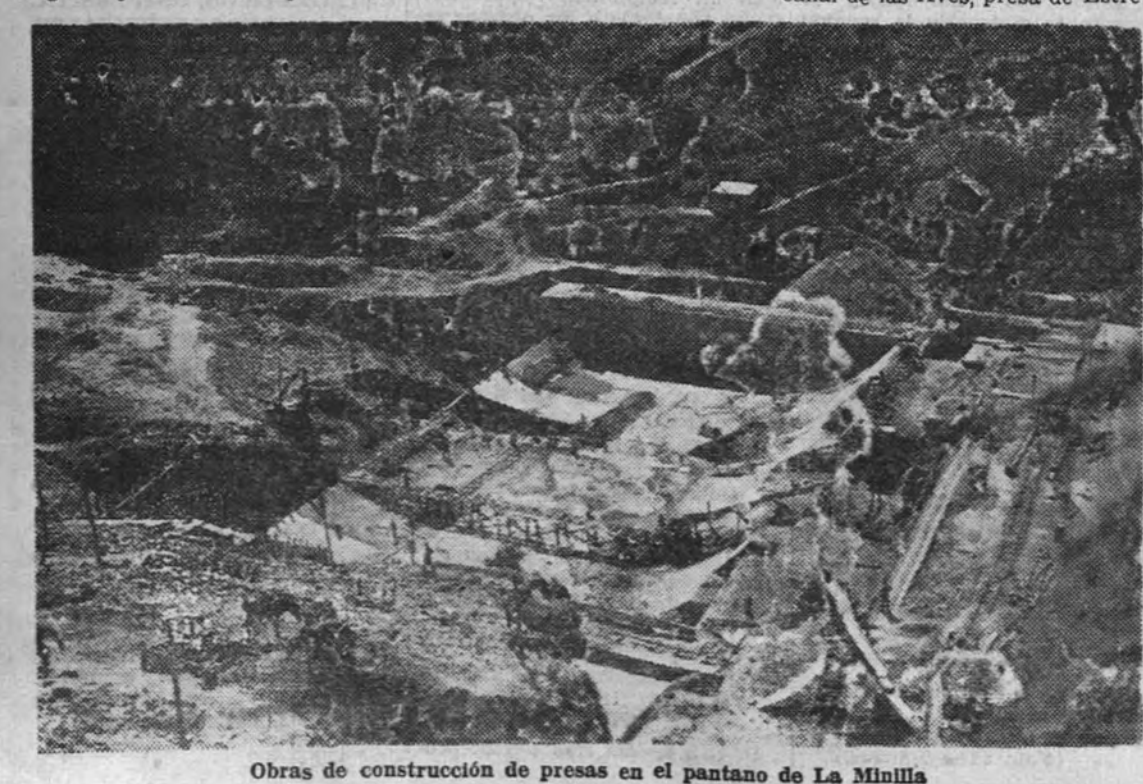
Obras de construcción de presas en el pantano de La Minilla