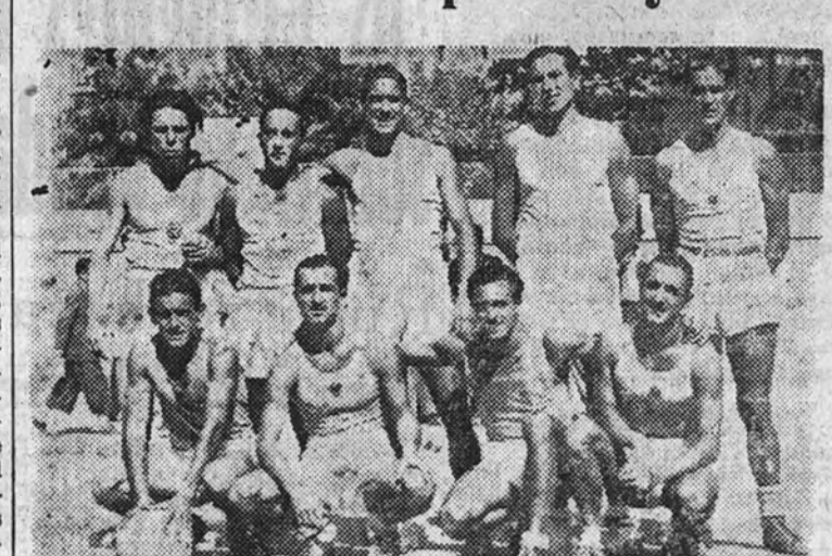
El equipo del Canoe, que venció copiosamente al Liceo Francés en la jornada inaugural de baloncesto

La primera jornada del Campeonato regional perdió gran parte de su interés al no jugar los encuentros América-S. E. U. y Yanquis-Imperio.