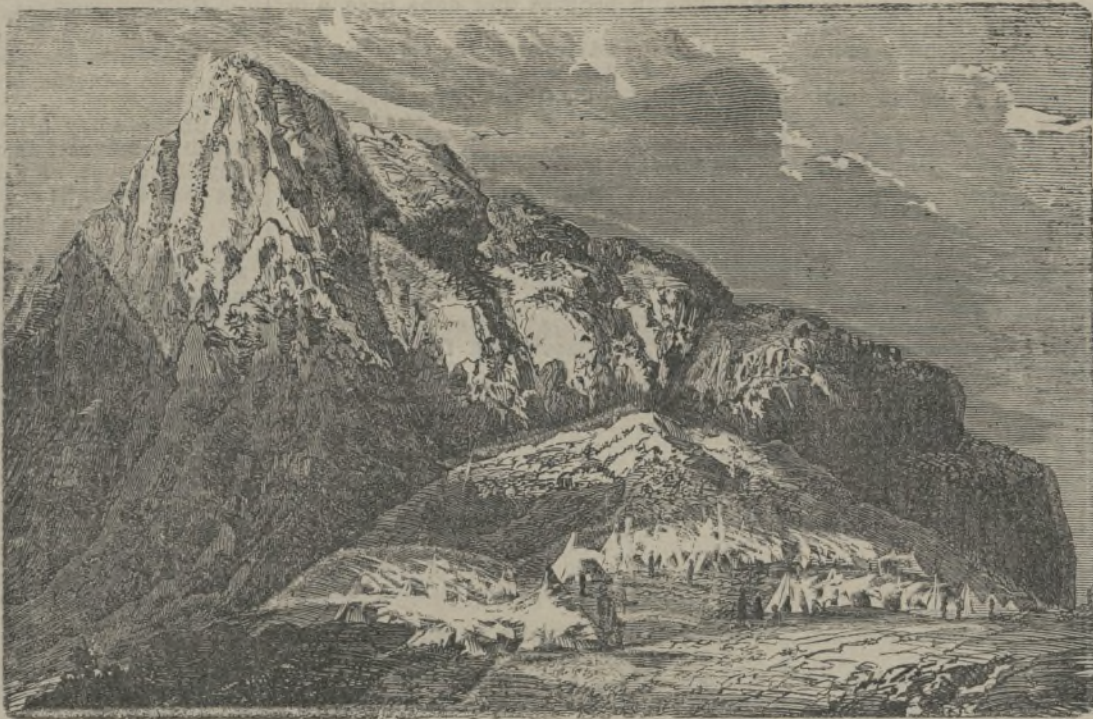
El Monserrat, visto desde Casa Masana.

Prometiéndome lo que me exigía, y lo ejecuté dos años más tarde, en 1814. En cuanto al segundo encargo que me hizo el joven jefe de batallón, le dije que á las dos horas de recibirlo, le dije que quería que su cuerpo fuese devorado por los muchos lobos que hallan en aquellos lugares; ¡me pidió que le enterrasen al lado de los bravos del 23 que habían sucumbido en el mismo combate!