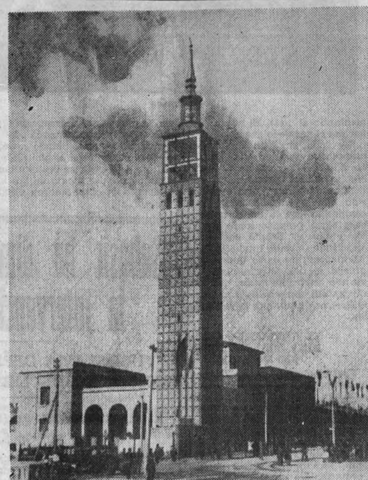
Exposición de la labor realizada en el fomento de la producción de algodón, tabaco, lúpulo, p'anta medicinales y patatas de siembra

dución de fibras textiles destaca especialmente las posibilidades del algodón en España, y que en la región aragonesa, dados los resultados de las experiencias de cinco años, pueden comenzar inmediatamente con el cultivo de más de cien hectáreas. Una pequeña demostración, funcionando, anima el "algodonoso stand", que atrae al labrador por sus abundantes copos de fibra blanca decorando paredes, columnas y empacado en las clásicas balas.