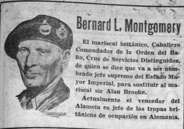
Bernard L. Montgomery

El mariscal británico, Caballero Comendador de la Orden del Baño, Cruz de Servicios Distinguidos, de quien se dice que va a ser nombrado jefe supremo del Estado Mayor Imperial, para sustituir al mariscal sir Alan Brooke.