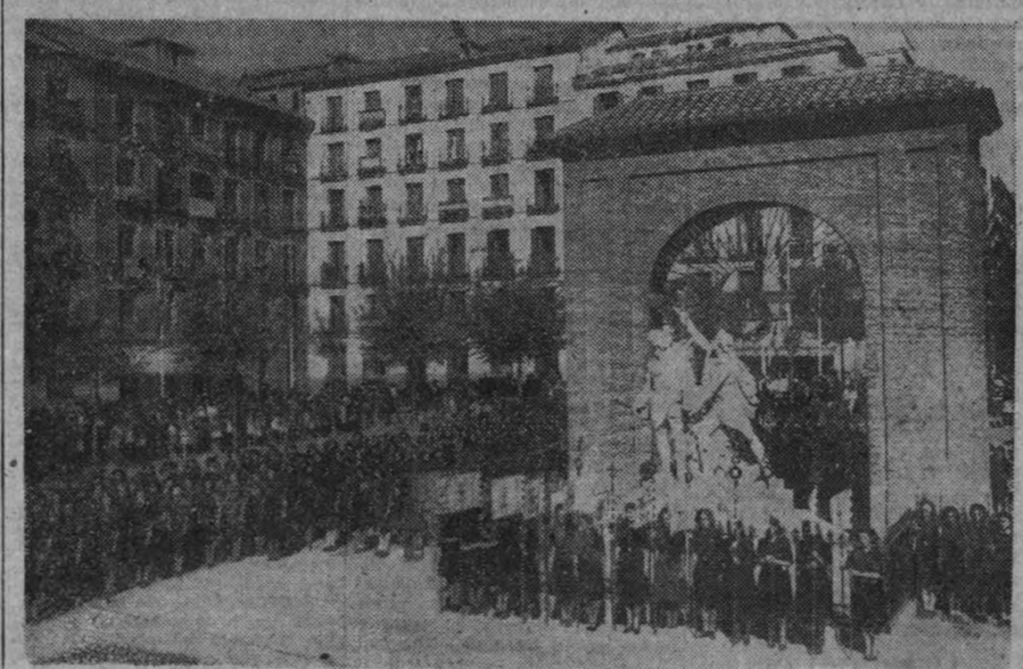
La foto recoge el aspecto de la plaza del Dos de Mayo de Madrid durante el solemne acto celebrado por la Sección Femenina para conmemorar la festividad de su Santa Patrona. (Información en segunda página.)