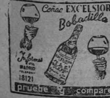
Corac EXCELSIOR Boloquilla