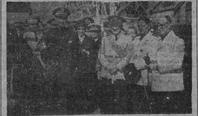
Los Ministros de Educación Nacional y Agricultura, a la salida del templo del Pilar de Zaragoza, después de asistir a la solemne ceremonia religiosa

El Ministro de Agricultura impuso varias condecoraciones