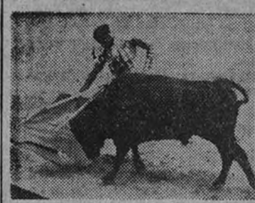
Aguado de Castro