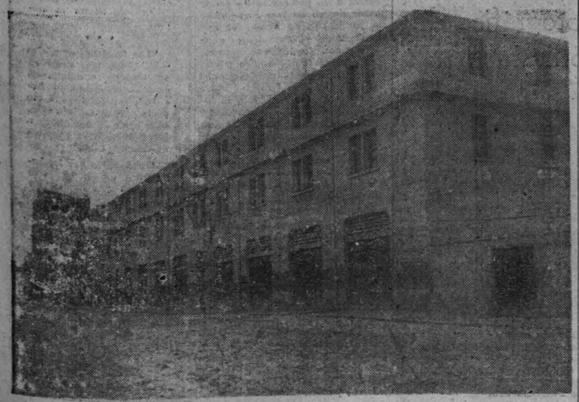
Vista general del edificio donde está instalado el Hogar Juvenil "Juan Canalejo"

En este trabajo, aun siendo parciales, nos hemos limitado a ocuparnos de la obra de la Falange corruñesa en su totalidad, habríamos de limitarnos, forzadamente, por exigencias imperiosas del espacio, exclusivamente a uno de sus aspectos.