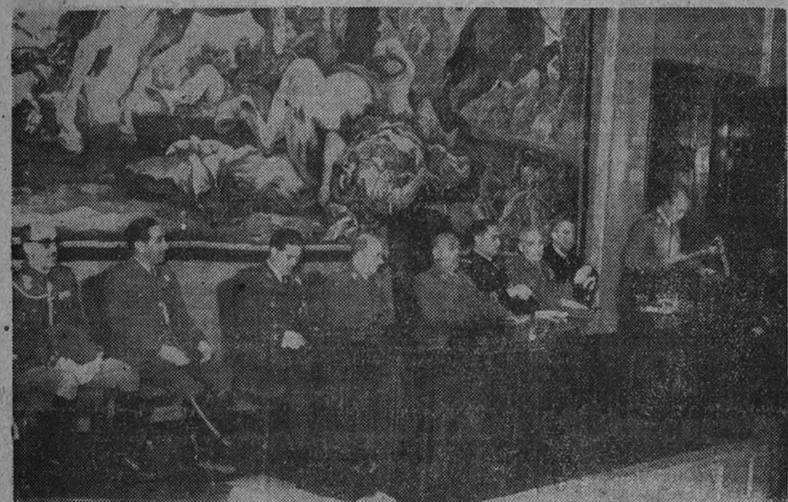
El Caudillo, con otras personalidades, preside el solemne acto de inauguración del curso en la Escuela Superior del Ejército

“Es imperiosa la necesidad de una mayor comprensión y solidaridad entre los pueblos” “Yo os exhorto a que os mantengáis celosos en defensa de la unidad de nuestra Patria” “España, por haber sabido descubrir antes que otras naciones la necesidad de lo social, tiene menos que corregir en el actual proceso del mundo”