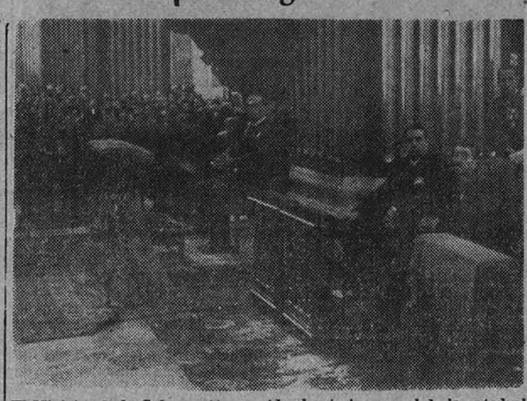
El Ministro de la Gobernación preside el acto inaugural de la catedral reconstruida de Vich

de dorada luz, en que ha parecido arder y resolverse el aire en la catedral reconstruida durante las magnas ceremonias de su entrega y de su inauguración.