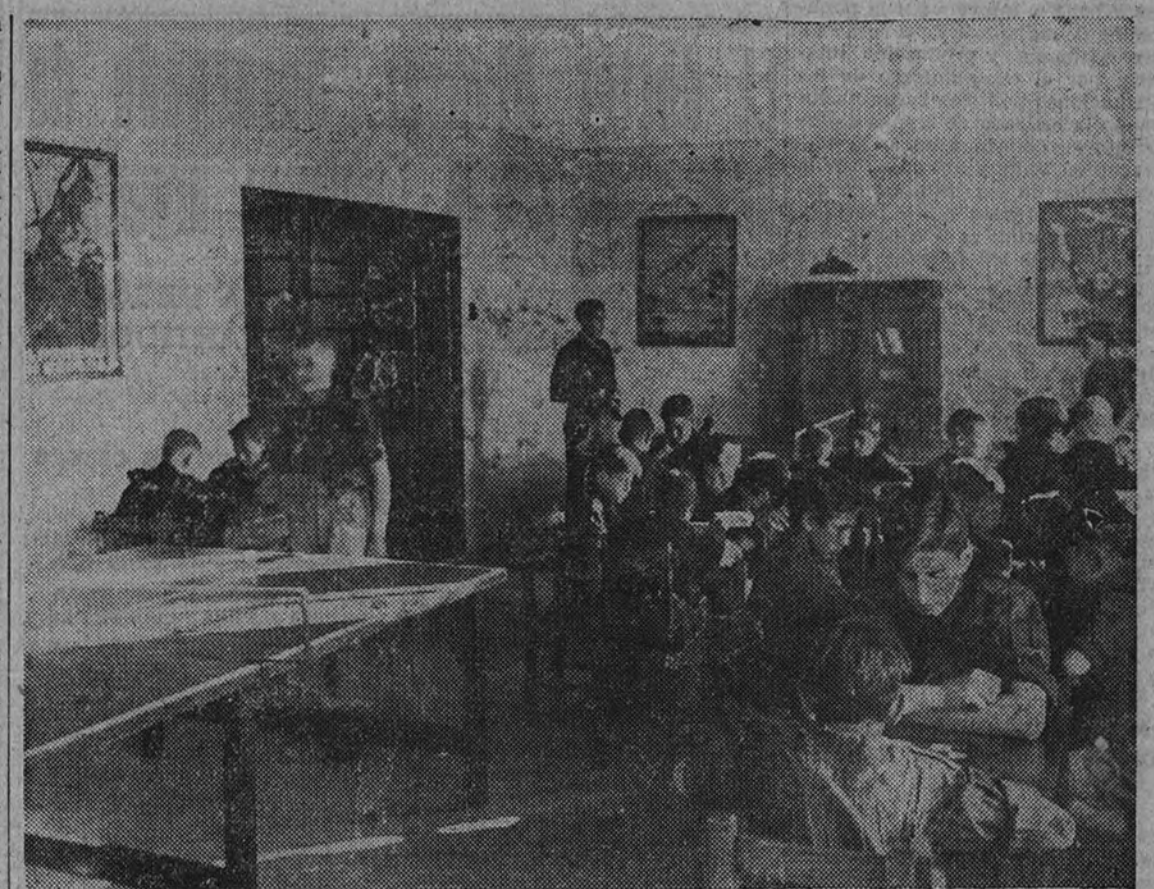
Un aspecto de una sala de juegos

nos antes, este Hogar constituye una hermosa realización de la Falange corruñesa, de la que con justicia puede enorgullecerse. Con su constitución se ha conseguido resolver varios problemas del mayor interés. De un lado, el alojamiento adecuado de los diferentes servicios del Frente de Juventudes, que hasta ahora no disponían de un local que reuniera las debidas condiciones; de otro, el que se refiere con la trascendental labor de formación de los camaradas del Frente de Juventudes, que ahora puede llevarse a cabo con los materiales y elementos necesarios y en dependencias apropiadas para dicho fin, y, por último, y quizás el más fundamental, es que con el funcionamiento del Hogar se ha conseguido liberar a los jóvenes de los grandes peligros de la calle, y que saben si de una futura vida de vicio y solazanería. En el Hogar encuentran un lugar agradable, alegre y cómodo, donde invertir benéficamente unas horas después que han salido del taller, de la oficina o de la escuela; allí pueden recibir una serie de enseñanzas, que les han de ser de gran utilidad para contribuir a su sustento el día de mañana; en el Hogar pueden practicar ejercicios gimnásticos, entre otros, en diversas formas o aumentar sus conocimientos en la biblioteca y, finalmente, para la formación del Frente de Juventudes es para ellos en suma una escuela de educación ciudadana, porque el frecuente contacto con sus demás camaradas servirá pa-