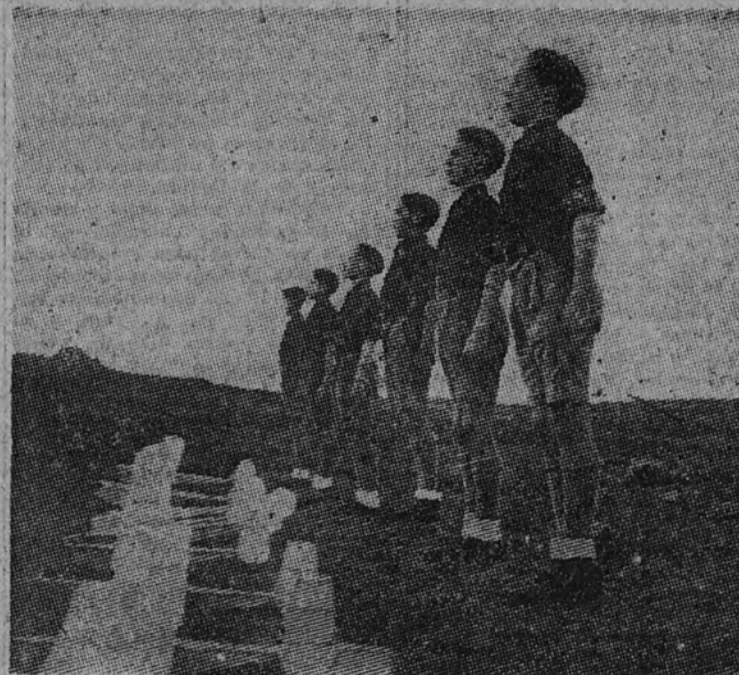
Una escuadra dispuesta para el lanzamiento de los aeromodelos

La situación del Hogar "Juan Canalejo" es verdaderamente admirable. Se levanta en las proxi-