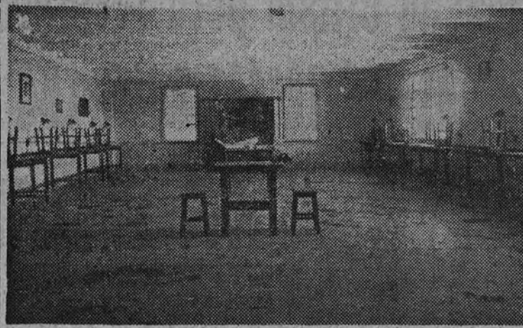
Aspecto de la sala de aeromodelismo

nos antes, este Hogar constituye una hermosa realización de la Falange corruñesa, de la que con justicia puede enorgullecerse. Con su constitución se ha conseguido resolver varios problemas del mayor interés. De un lado, el alojamiento adecuado de los diferentes servicios del Frente de Juventudes, que hasta ahora no disponían de un local que reuniera las debidas condiciones; de otro, el que se refiere con la trascendental labor de formación de los camaradas del Frente de Juventudes, que ahora puede llevarse a cabo con los materiales y elementos necesarios y en dependencias apropiadas para dicho fin, y, por último, y quizás el más fundamental, es que con el funcionamiento del Hogar se ha conseguido liberar a los jóvenes de los grandes peligros de la calle, y que saben si de una futura vida de vicio y solazanería. En el Hogar encuentran un lugar agradable, alegre y cómodo, donde invertir benéficamente unas horas después que han salido del taller, de la oficina o de la escuela; allí pueden recibir una serie de enseñanzas, que les han de ser de gran utilidad para contribuir a su sustento el día de mañana; en el Hogar pueden practicar ejercicios gimnásticos, entre otros, en diversas formas o aumentar sus conocimientos en la biblioteca y, finalmente, para la formación del Frente de Juventudes es para ellos en suma una escuela de educación ciudadana, porque el frecuente contacto con sus demás camaradas servirá pa-