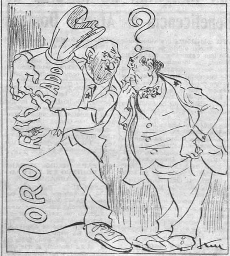
Indulto para los expatriados Por KIN

Descuiden; estaremos todos pendientes de emisiones del servicio de socorro.