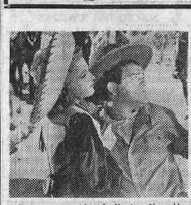
"Galopa, muchacho", la divertida comedia de Bud Abbott y Lou Costello, se estrenará mañana jueves en el Colisevm.

MARIA MONTEZ · JON HALL · TURHAN BEY ALI BABA Y LOS 40 LADRONES En un film Universal (4975 P)