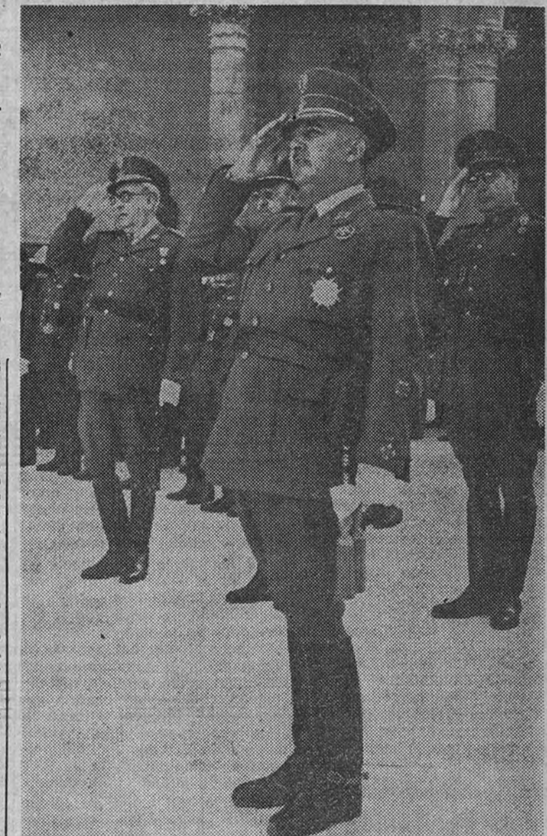
Franco, en el Alcázar

LONDRES 26.—El Rey ha hecho un llamamiento a los científicos, relativo al desarrollo de la energía atómica. «Debemos rogar que se llegue a un acuerdo para hacer las cosas bien, antes de que sea demasiado tarde», dice el Soberano británico. Añade en su llamamiento que sólo debe emplearse la energía atómica en la paz y como beneficio de la Humanidad. (Efe.)