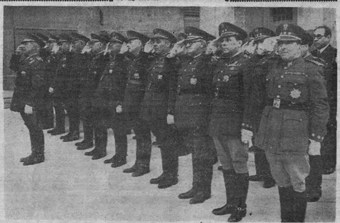
Los compañeros de promoción de Su Excelencia el Generalísimo formados en el patio del Alcázar

BERLIN 26.—Hoy han empezado las “operaciones Stock”, que comprenden la evacuación de cincuenta mil niños de Berlín a la zona inglesa del oeste de Alemania. La mayoría de los evacuados vestían sus mejores trajes cuidadosamente planchados, y