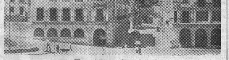
Una vista de Guernica

La más categórica réplica a la difamación sobre Guernica