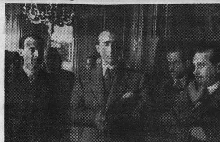
El Ministro de Agricultura, camarada Rein, durante el discurso que pronunció al dar posesión de su cargo al nuevo director general de Ganadería.

El Ministro de Agricultura, camarada Carlos Rein, dió posesión de su cargo ayer tarde, en su despacho oficial, al nuevo director general de Ganadería, señor Carbonero Bravo.