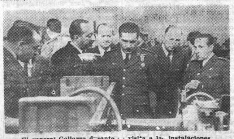
El general Gallarza durante su visita a las instalaciones