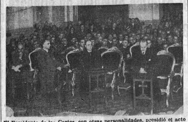
El Presidente de las Cortes, con otras personalidades, presidió el acto religioso inaugural del centenario del Apostolado de la Oración, celebrado en la catedral.

EL PRESIDENTE DE LAS CORTES Y OTRAS PERSONALIDADES ASISTIERON AL ACTO