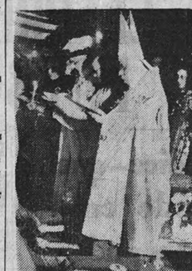
El Nuncio de Su Santidad presidió el acto de armar caballeros de la Orden del Santo Sepulcro

Ofició en el acto el Nuncio de Su Santidad