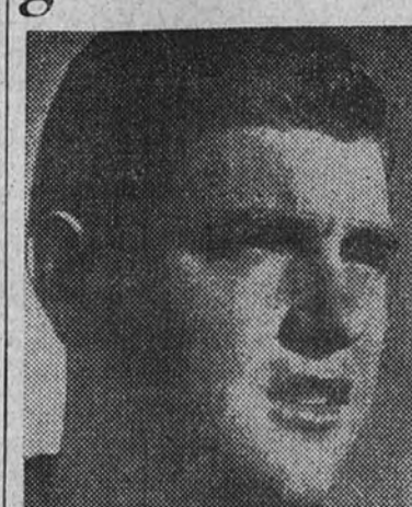
Bustos y Pérez, porteros del Sevilla y Atlético Aviación, respectivamente, que esperamos tengan bastantes oportunidades para lucirse

La rapidez y el preciosismo sevillista frente al juego geométrico del Aviación