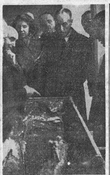
El duque de Alba presidió la exhumación de los restos de su antepasada

En el sorteo celebrado ayer, día 17, ha sido premiado el número