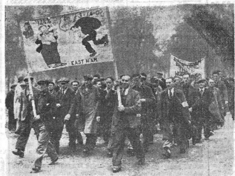
Obreros de la construcción de Londres recorren la ciudad en manifestación solicitando en las pancartas de que son portadores la elevación de salarios, las vacaciones retribuidas de quince días anuales y la seguridad de sus jornales íntegros en caso de suspensión del trabajo por malas condiciones atmosféricas.