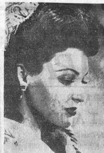
Copiosa presentará el film de René Clair "¡¡¡Sucedio mañana!!". Linda Darnell es la protagonista de esta cinta

En consecuencia, toda inserción de anuncio en esta Sección está condicionada a la previa autori-