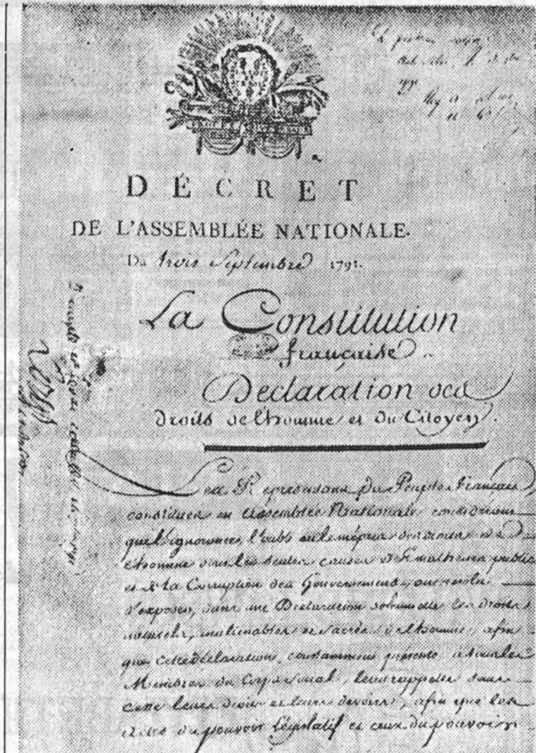
Constitución de 1791. Primera página del manuscrito del 3 de septiembre de 1791 con la «Declaración de los derechos del hombre» y la ratificación de Luis XVI

Designado nuevamente el general De Gaulle jefe del Gobierno de Francia se inicia para la recién elegida Asamblea Constituyente su tarea fundamental y concreta: redactar el texto de la nueva Constitución política que ha de regir la vida de la IV República. Y ha de elaborarla en un breve espacio de tiempo. Siete meses, como máximo. Esa limitación de funciones ha sido uno de los grandes éxitos de De Gaulle, frente a un amplio sector del partido comunista, que deseaba una Convención soberana. Es difícil adivinar cuál será el contenido del nuevo texto constitucional, el undécimo desde la revolución de 1789; pero es seguro que los principios democráticos que desde hace siglo y medio vienen nutriendo el derecho constitucional francés, tendrán también cabida en la nueva Carta política. Ya es interesante, que el cabo de tanto tiempo aun tenga validez en Francia la doctrina de Sieyès: «El poder de hacer una Constitución pertenece sólo a una Asamblea elegida con el mandato concreto de hacerla».