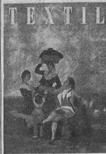
Acaba de aparecer el número 21 de esta admirable revista, editada por el Sindicato Vertical Textil.

No podemos dejar de señalar el éxito creciente de esta publicación, tanto en lo que se refiere a su admirable confección y a la profusión de grabados de una gran calidad artística muchos de ellos, con que se ilustran todas sus secciones, como a su contenido. Al lado de artículos de nuestros más prestigiosos técnicos en tan importante industria, ofrece esta revista una amplia información de palpante actualidad e indudable interés para todos aquellos a quienes de una manera u otra afecta esta rama industrial. Contiene además este número, correspondiente al mes de septiembre, los suplementos números 5 y 6 de Recopilación Legislativa.