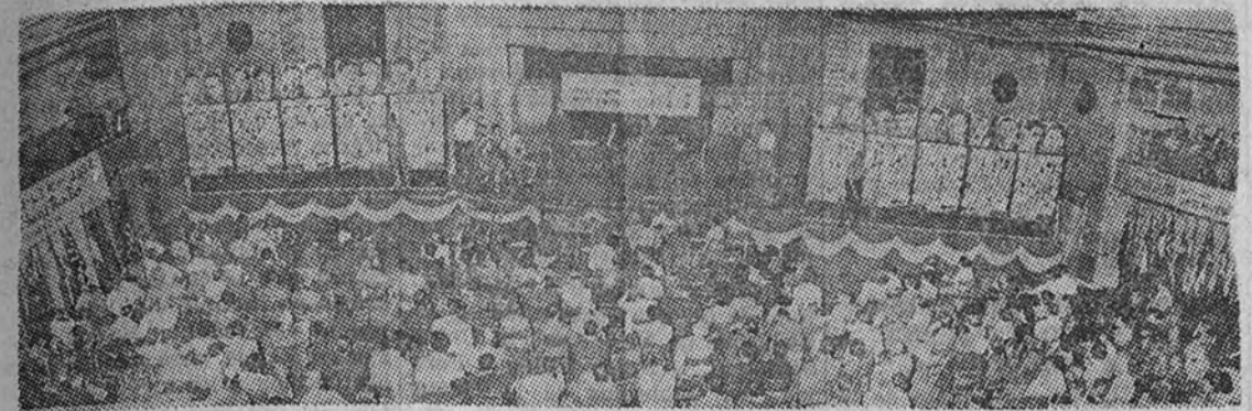
Panorámica del último encuentro vía radio de ajedrez, que se ha jugado en los Estados Unidos