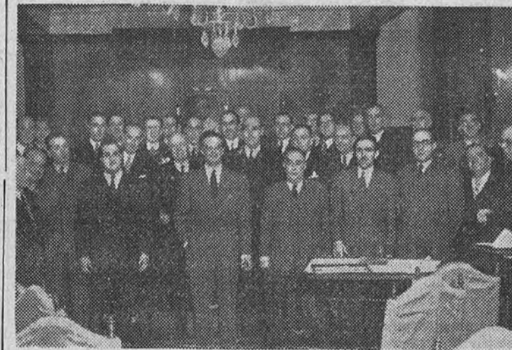
Los Presidentes de las Diputaciones españolas reunidos con motivo de la Asamblea celebrada ayer

Hoy se reunirá el Comité que entregará los acuerdos al Ministro de la Gobernación