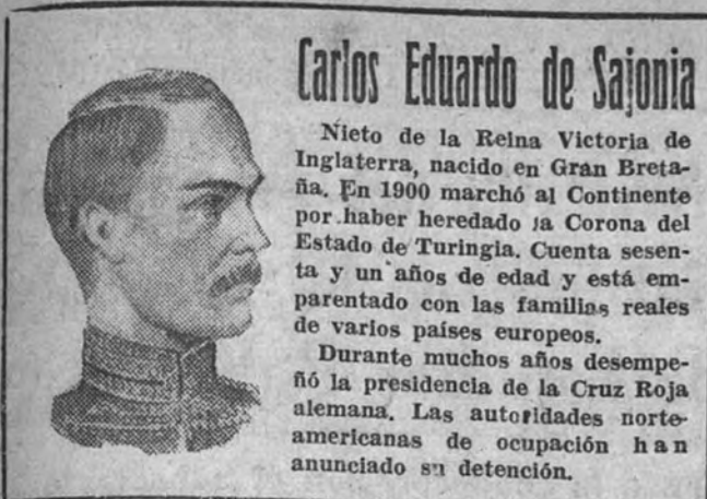
Carlos Eduardo de Sajonia

Nieto de la Reina Victoria de Inglaterra, nacido en Gran Bretaña. En 1900 marchó al Continente por haber heredado la Corona del Estado de Turingia. Cuenta sesenta y un años de edad y está emparentado con las familias reales de varios países europeos.