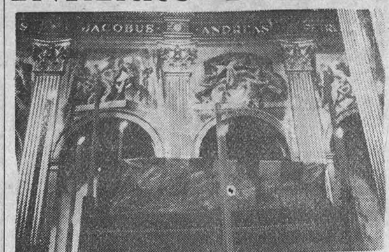
El féretro que contiene los restos mortales del pintor, instalado en la catedral de Vich, donde se celebraron solemnes funerales antes de proceder a su enterramiento. Al fondo pueden verse algunos de los frescos que, obra del eminente artista, decoran las naves de la catedral