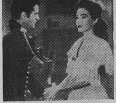
Francis Lederer y Lynn Bari en "El puente de San Luis Rey", película cuyo estreno se aguarda con verdadera expectación

Gracias nuestra y artistas nuestros en un film avalado por los éxitos obtenidos en Valencia, Valladolid y otras capitales es lo que la pantalla del Rialto nos ofrece a partir de hoy. "Un hombre de negocios", que fué un éxito teatral extraordinario, ha recibido una acertada versión cinematográfica para convertirse en film, dirigida por Luis Lucia para Cifesa Producción, en el mejor film cómico rodado en España.