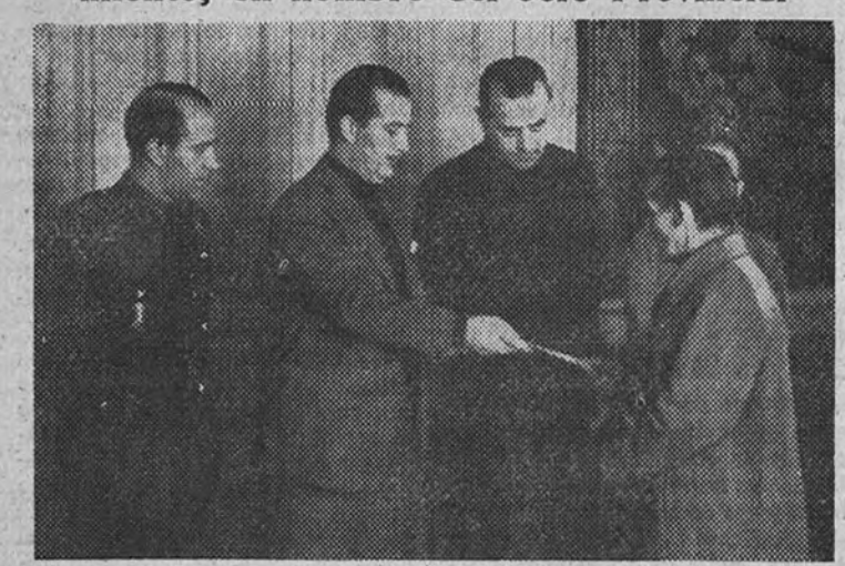
El acto de entrega de premios del S. E. M. a los profesores del Frente de Juventudes

Fueron distribuidos por el Subjefe del Movimiento, en nombre del Jefe Provincial