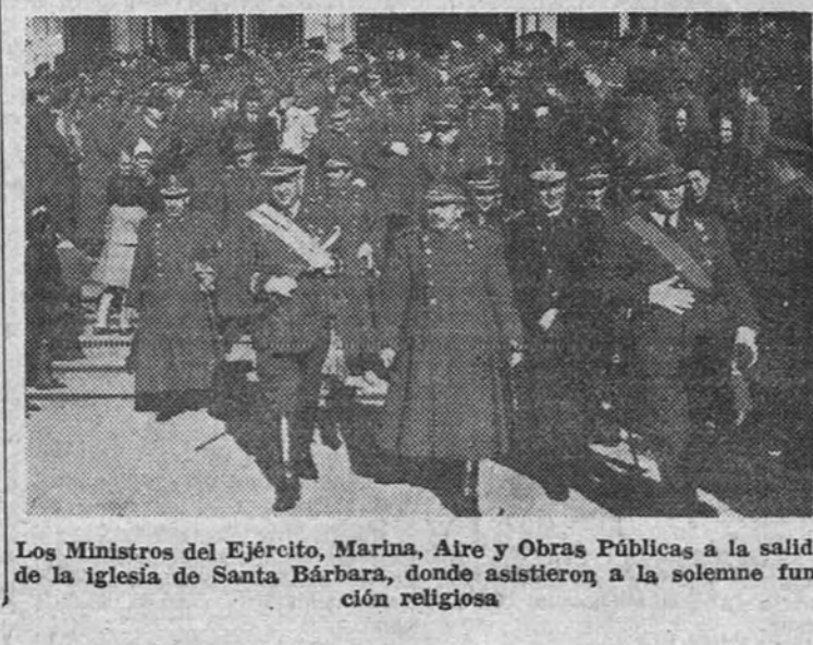
Los Ministros del Ejército, Marina, Aire y Obras Públicas a la salida de la iglesia de Santa Bárbara, donde asistieron a la solemne función religiosa