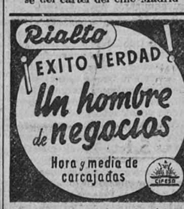
Hoy y mañana, tres funciones: 4.15, 6.45 y 10.30 TOLERADA MENORES (5377 A)