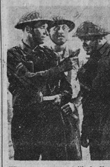
"El sargento inmortal", de Fox, es uno de los grandes éxitos cinematográficos actuales. He aquí una escena de esta película, basada en el cartel del cine Madrid