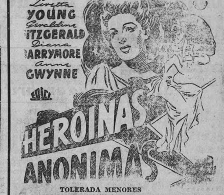
TOLERADA MENORES (5383 A)

EL LUNES, ESTRENO DE "HEROINAS ANONIMAS" Sobre el dramático paisaje de la guerra y bajo las alas heróicas de la aviación norteamericana, Walter Wanger ha creado un emocionante melodrama.