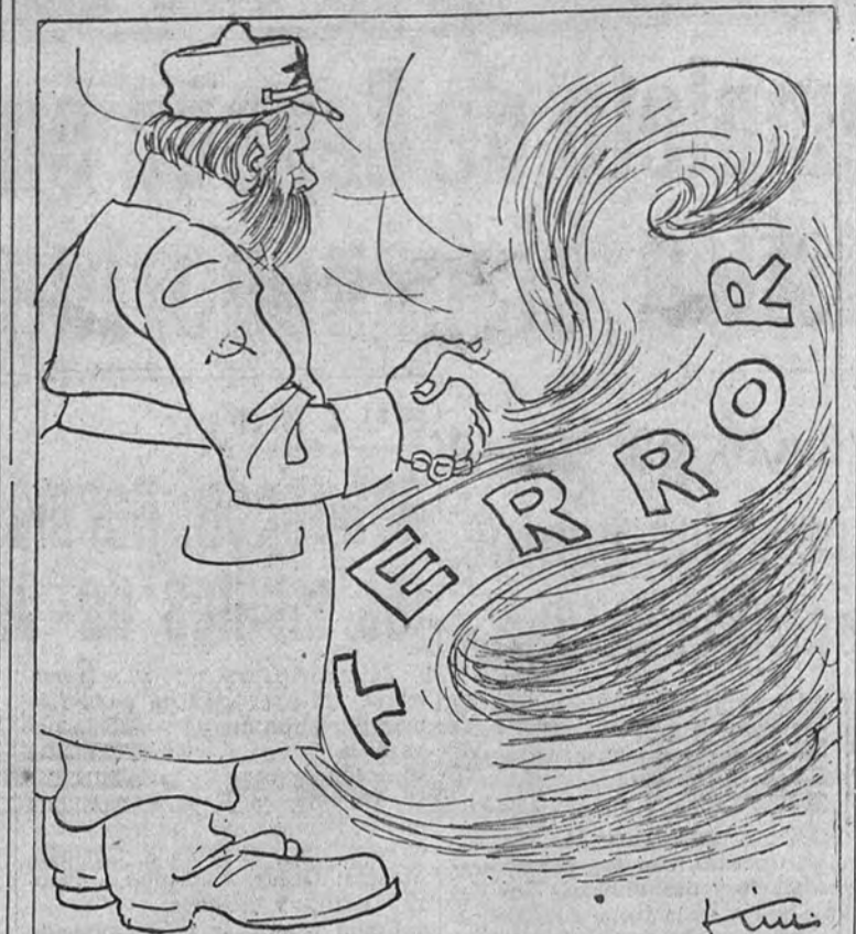
«Estalla una ola de terror en el norte de Persia.» (De la Prensa.)