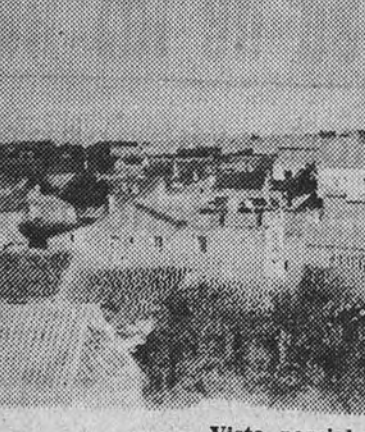
Vista parcial del pueblo