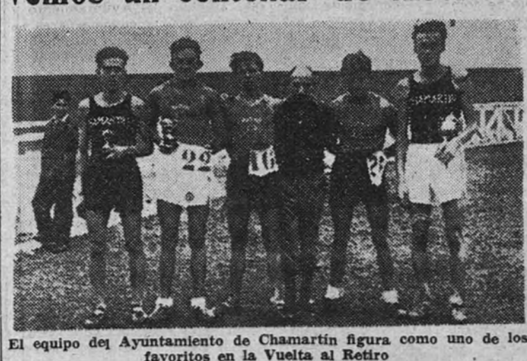
El equipo del Ayuntamiento de Chamartín figura como uno de los favoritos en la Vuelta al Retiro

Por primera vez esta temporada vemos un centenar de inscritos