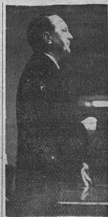
El Ministro de Justicia durante su discurso