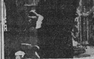
Hispanmex anuncia la presentación del galán Arturo de Cordova, figura destacadísima del cine mejicano