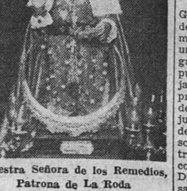
Nuestra Señora de los Remedios, Patrona de La Roda.

1939 a estos países respecto a la inviolabilidad de los mismos. También mencionó la petición formulada por el fallecido Presidente Roosevelt en el mes de abril de 1939 para que las fuerzas armadas alemanas garantizaran los territorios de estos países y otros y ras. «Seguidamente, el fiscal citó la orden de von Brauchitsch, en la cual se decía que el grupo de Ejércitos «E» debería estar dispuesto para invadir inmediatamente Bélgica, Holanda y Luxemburgo si la situación política lo exigía, tan pronto como recibiera órdenes especiales».