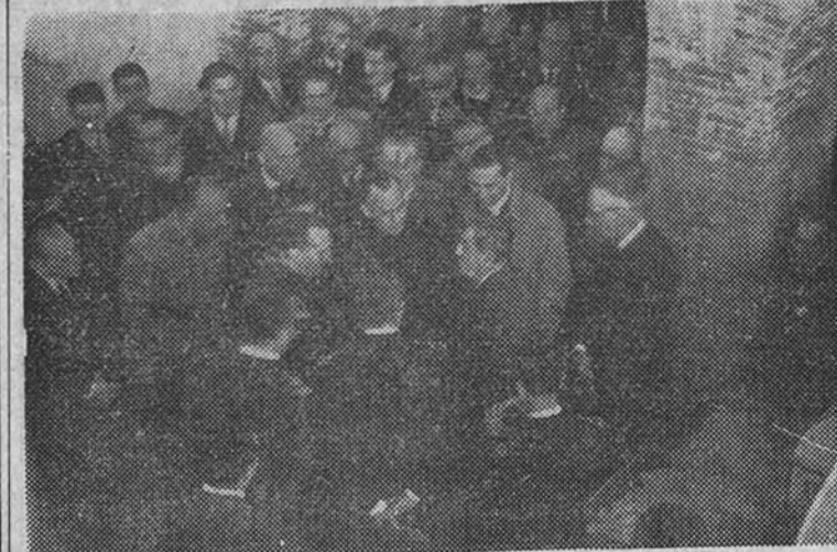
El Ministro de Agricultura preside en Málaga la inauguración de una importante factoría algodonera

Asistió al acto el Ministro de Agricultura, que impuso varias condecoraciones