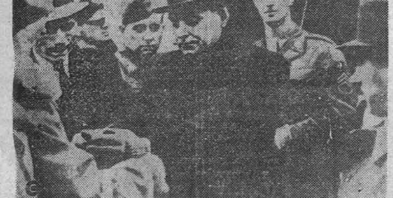
Szalasy, en el momento de ser espasado cuando llegó en avión a Budapest para ser juzgado.

LONDRES 10.—El ex presidente del Consejo húngaro Szalasy ha sido sentenciado a muerte por un Tribunal Popular de Budapest.