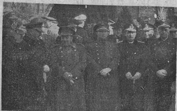
Los Ministros del Aire, Ejército, Marina, Gobernación e Industria y Comercio al salir de la función religiosa celebrada en honor de Nuestra Señora de Loreto