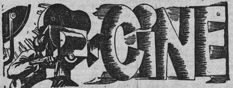
2.ª SEMANA DE CLAMOROSO EXITO

"Habrá que seguir, paso a paso, cada episodio de esta gran película para demostrar no sólo sus valores morales, sino la estupenda realización con que están consigui-