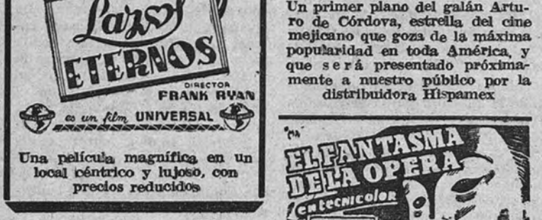
SEGUNDA SEMANA DE "LAZOS ETERNOS" EN EL IMPERIAL

El cine Imperial ha inaugurado brillantemente su temporada de primeros estrenos con "Lazos Eternos", creación de la encantadora estrella Diana Durbin y uno de los mayores triunfos interpretativos de esta artista, Diana Durbin, la admirable cantante y actriz, se nos muestra en esta película en la plenitud de sus facultades al servicio de un argumento todo interés y emoción.