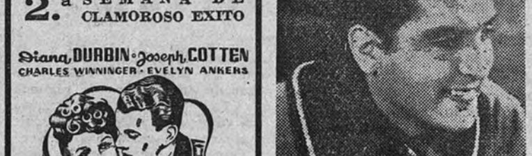
Un primer plano del galán Arturo de Cordova, estrella del cine mejicano que goza de la máxima popularidad en toda América, y que se irá presentado próximamente a nuestro público por la distribuidora Hispanamex