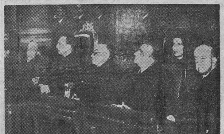
El Ministro de Justicia, con el presidente del Supremo y el decano del Colegio de Abogados, presiden la solemne función religiosa celebrada en la Iglesia de Santa Bárbara