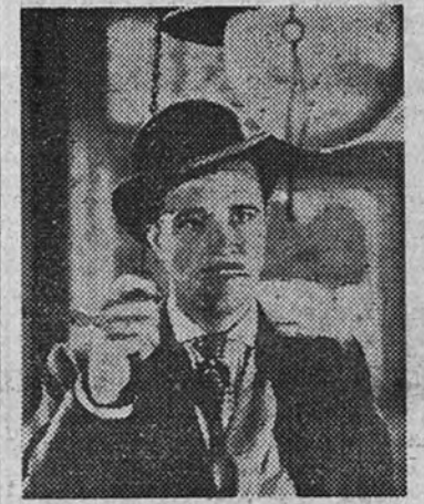
Rene Clair, el gran realizador cinematográfico, ha dado una prueba más de su ingenio con el film humorístico "¡Sucedio mañana!". De Cepica, que ha entrado en su segunda semana de proyección en el Avenida. Dick Powell actúa como protagonista en esta original película

LONDRES.—El redactor diplomático del "Sunday Dispatch" informa que el ministro de Relaciones Exteriores, Bevin, pedirá a Molotov una explicación sin reservas sobre las intenciones rusas en su política exterior y sobre los requerimientos definitivos de Rusia en Europa. Dicho periódico añade que la pregunta de Bevin a Molotov servirá de base para cualquier acuerdo entre los aliados occidentales y la Unión Soviética en los futuros propósitos de compartir interludamente la energía atómica. (Efe.)