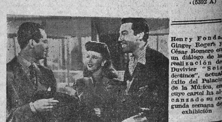
Henry Fonda, Ginger Rogers y César Romero en un diálogo de la realización de Duvivier "Seis destinos", actual éxito del Palacio de la Música, en cuyo cartel ha alcanzado su segunda semana de exhibición