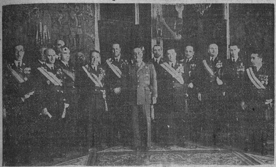
El Ejército del Aire, presidido por el Ministro, general don Eduardo González Gallarza, cumplimentó ayer a Su Excelencia el Generalísimo, al que renovó su inquebrantable adhesión.

Los Ministros del Aire, Ejército, Marina, Gobernación e Industria y Comercio presidieron una solemne función religiosa