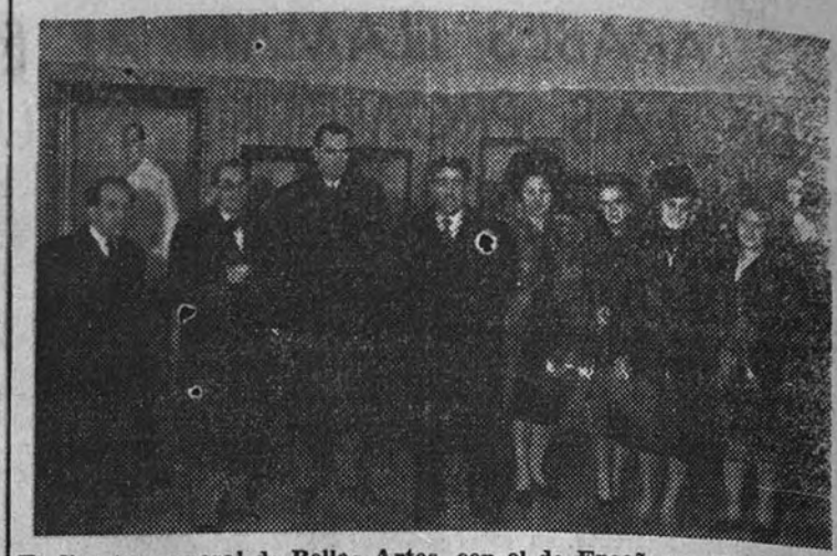
El director general de Bellas Artes, con el de Enseñanza Profesional y Técnica, en el acto de clausura de la Exposición de Castro Cires, en el Museo de Arte Moderno