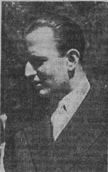
Fernández-Cid música contemporánea en España.

En la tarde de ayer, en el Círculo "Medina", nuestro camarada Antonio Fernández-Cid dió su anunciada conferencia sobre "La