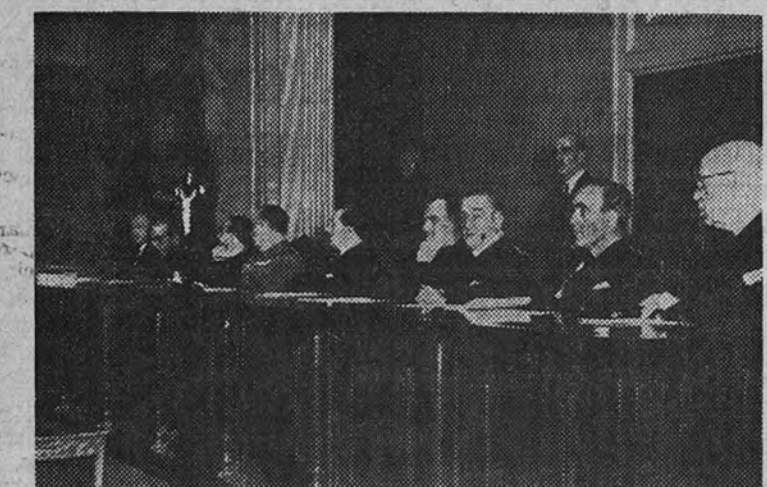
El Subsecretario de Educación Nacional preside el solemne acto de la entrega de títulos a los ingenieros industriales