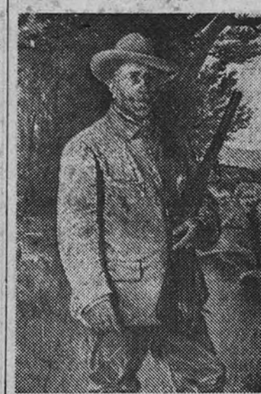
«Autorretrato», una de las bellas obras de Agramunt

La Exposición de óleos y acuarelas del artista Francés Agramunt, que con tanto éxito se celebraba en los salones del Círculo de Bellas Artes, será clausurada en la tarde del próximo lunes. Últimamente fué visitada por el ex Ministro Miguel Primo de Rivera, el Gobernador Civil, Carlos Ruiz, y otras personalidades, que hicieron grandes elogios de la Exposición.