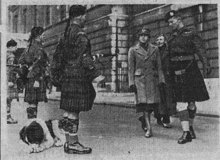
Ante el Palacio de Buckingham la princesa real de Inglaterra—hermana de Jorge VI—pasa revista a un regimiento escocés, del que es coronel honorario