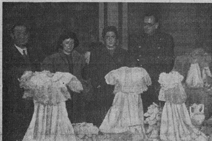
La Delegada Nacional de la Sección Femenina, con el Jefe Provincial del Movimiento y la Delegada Provincial, durante la visita inaugural que hizo ayer a la Exposición de canastillas

Asistieron a la apertura la Delegada Nacional, el Jefe Provincial del Movimiento y otras jerarquías