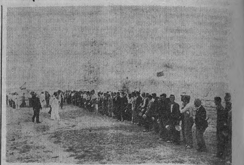
El Delegado Nacional de Sindicatos visita a los productores en un campo de trabajo instalado por la Obra.

Nuestro esfuerzo se centra alrededor de las siguientes premisas: emprender obras que absorban principalmente jornales; realizar otras que por su marcado interés nacional y naturaleza no lucrativa, queden relegadas a segundo término por la iniciativa privada; cooperar activamente con los servicios centrales y provinciales de Colocación Obrera, facilitando y orientando los movimientos migratorios laborales que exija el interés nacional; proporcionando, en fin, a las Empresas privadas, la mano de obra que necesitan y regularan y, por último, proponer o facilitar al Estado, en desvelo constante de colaboración, los proyectos o fórmulas que en un mo-