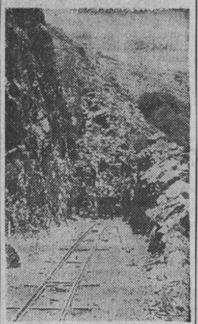
Trincheras en construcción para el importante ferrocarril de Sierra Nevada.

Nace la Obra Sindical en fecha relativamente reciente: año 1943. Su actividad se desarrolla, en un principio, debido a naturales dificultades de organización, modestamente; pero ese esfuerzo inicial resulta altamente alicionador y de él surge la experiencia necesaria-