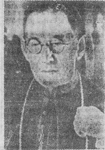
Doctor don Manuel Arce

En la primera creación de cardenales que va a llevar a cabo San Pío XII, y que tendrá lugar el 18 del próximo mes de febrero, se registran por primera vez en la historia de la Iglesia una serie de circunstancias que hacen de este Consistorio el más importante, sin duda alguna, en los anales del Sacro Colegio.