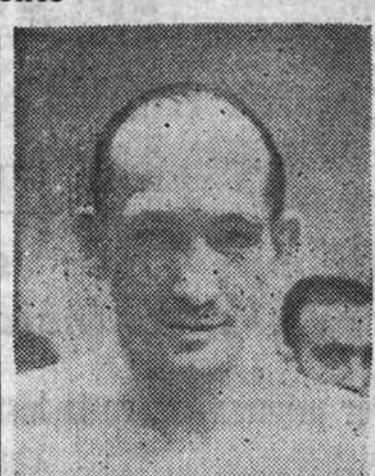
Ara sigue quedando en posesión del título de los medios al hacer combate nulo con Llorente

Cerró la reunión el encuentro entre Arciniega, con 83.400, y Medrano, con 80.400. En el primer asalto Arciniega derribó a