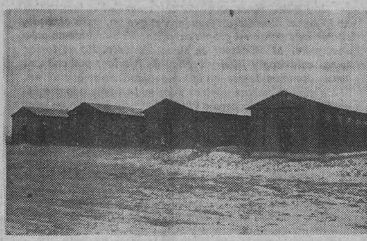
Barracones de invierno en el campamento de Barajas.