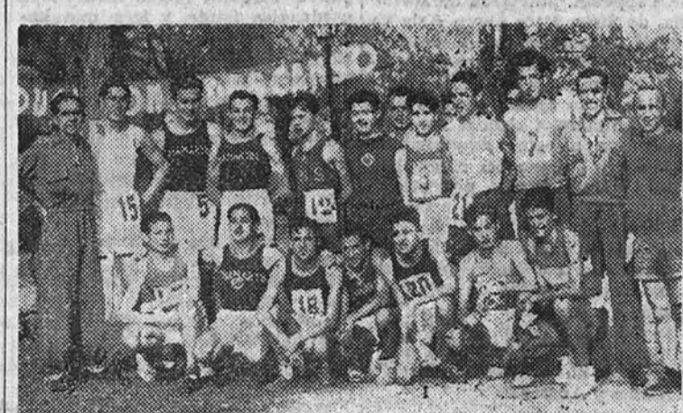
Grupo de corredores pedestres que participaron en la Copa de Navidad

El domingo por la mañana se celebró la interesante prueba de campo a través organizada por Educación y Descanso sobre un recorrido de ocho kilómetros, con la meta de salida y llegada establecida en el paseo de Monistrol, frente a la piscina de La Isla.