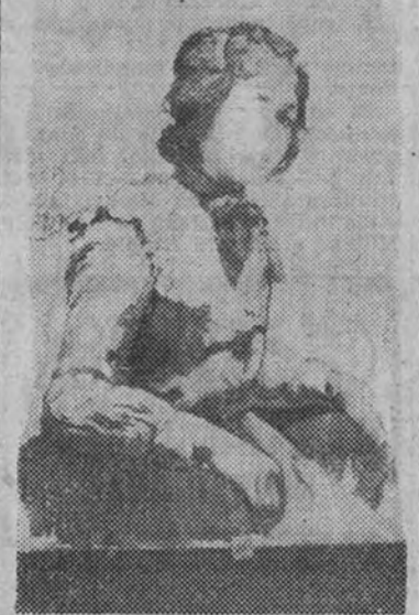
Una de las obras presentadas por el pintor Fernando Cabrera Cantó.

Con asistencia de un distinguido público, entre el que figuraban personalidades del arte y de las letras, ha sido inaugurada en la Sala de Estampas del Museo de Arte Moderno una importante Exposición del gran pintor levantino Fernando Cabrera Cantó, en la que figuran obras de positivo mérito.