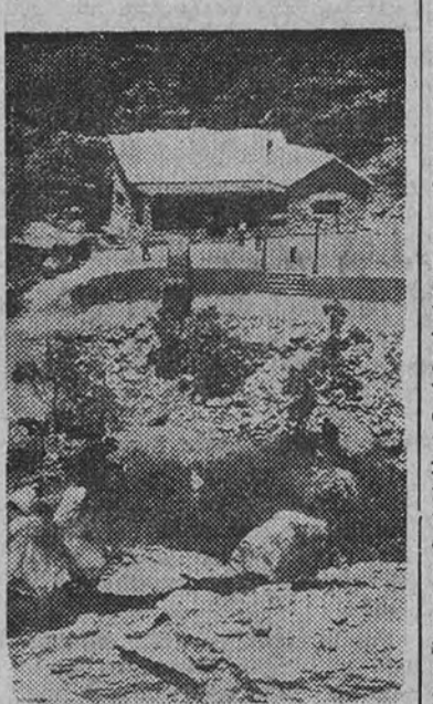
Vista parcial del campamento del Grupo de Trabajo San Juan, instalado en Granada.

Ante un paro estático, bien determinado, se puede adoptar una postura de expectativa. No forz nada, facilitar todo, poner en relación la demanda con la oferta de trabajo, y, entre tanto, cubrir las necesidades mínimas del parado, ya mediante el subsidio, ya por medio de su empleo profesional.