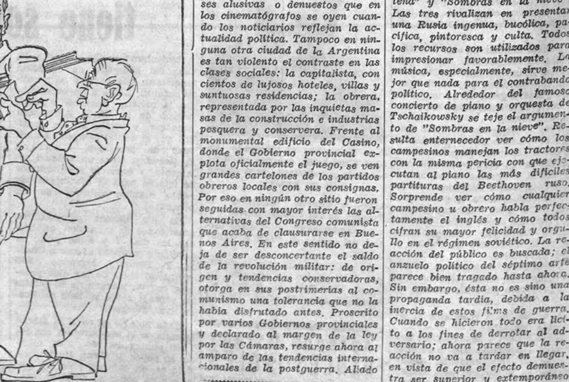
—Es terrible, Juan! En esta agenda llevo la cuenta de los que han metido con España este año.

—Pues no le veo la importancia. En éste, que acabo de terminar, la llevo yo de los que no se han metido!.