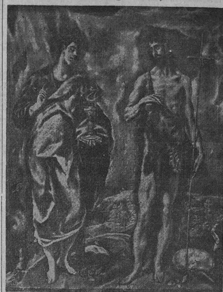
«Los Santos Juanes», por el Greco

Junto a Velázquez, El Greco, Martínez Montañés y Ribalta, biblias góticas y relieves en piedra