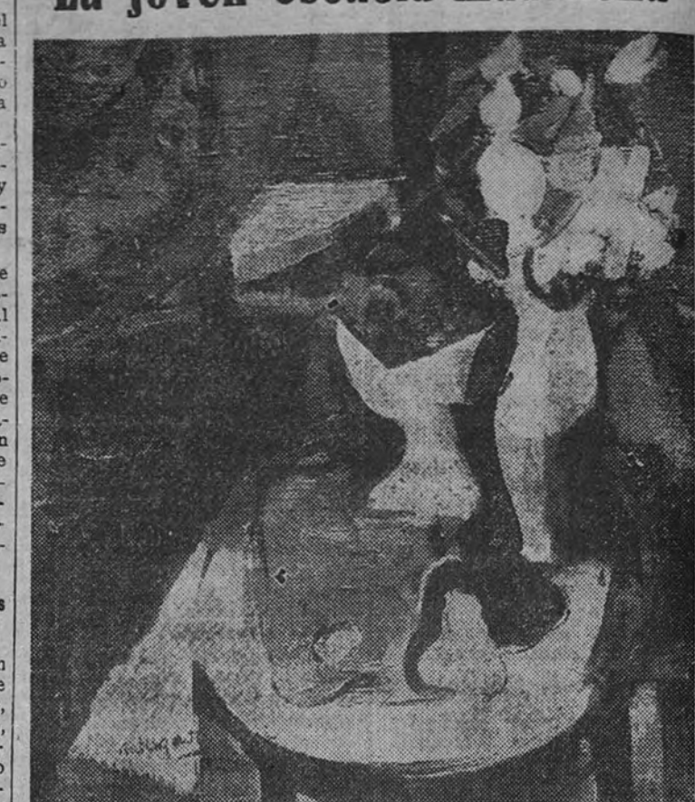
Oleo de Alvaro Delgado

Bajo el título "La joven escuela madrileña" reúne la Galería Buchholz la obra de algunos de nuestros artistas jóvenes más inquietos, presidida por el arte sensible de José Planes. La denominación no responde a una verdadera identidad escolástica, ni aun en la diversidad de tendencias, a un carácter local. Por el contrario, la orientación de estos artistas, procedentes de diversas regiones, se adscribe a la corriente universalista de nuestro arte en contacto más o menos profundo con las distintas formas del postimpresionismo. Hay, en cambio, una perfecta unidad sensible en este conjunto: un aire familiar creado por el noble afán de superar el realismo usual y dar curso libre al sentimiento.