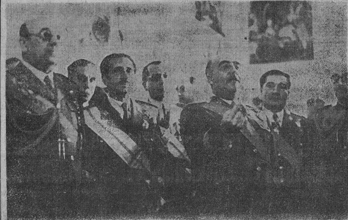
El Caudillo pronuncia su discurso ante los generales y jefes que asistieron a la recepción