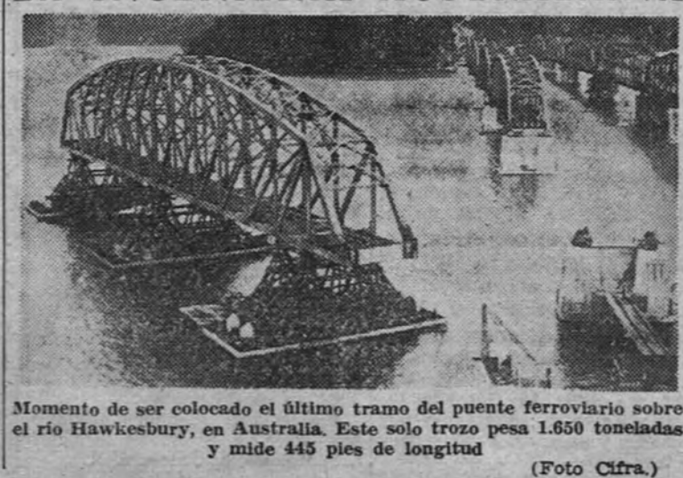
Momento de ser colocado el último tramo del puente ferroviario sobre el río Hawkesbury, en Australia. Este solo trazo pesa 1.650 toneladas y mide 445 pies de longitud