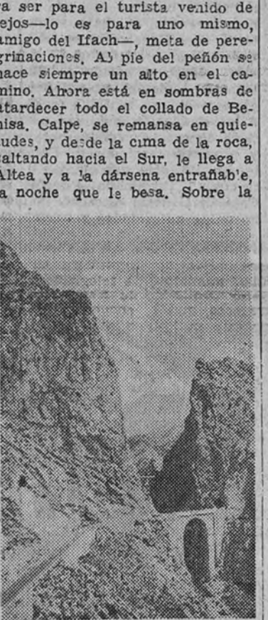
El bravo Mascarat y la enorme cuchillada de su tajo

manso de la ensenada calpeña sus naves, con el afán de la conquista en los feudos Mitores, que por enemigos, eran codicia y sinfonia. Hoy, como contraste, el Ifach tiene a sus pies, viéndose como el horizonte en calma y amparado en soles sempiternos al Parador de Turismo. Bien supo elegir el Patronato un lugar tan propio a la contemplación y a lo amable. Porque el Ifach nos prende en atracciones y en preteritos. Para la placidez de la caricia y del ensueño mentales. Ifach es el mejor amigo por estas latitudes en los días presentes. La ruta de Calpe en estas fechas de los meses solitarios, como con estos de cara al invierno, debería ser para el turista venido de lejos—lo es para uno mismo, amigo del Ifach—, meta de peregrinaciones. Al pie del peñón se hace siempre un alto en el camino. Ahora está en sombras de stardecir todo el collado de Benisa, Calpe, se remansa en quietudes, y de la cima de la roca, saltando hacia el Sur, se llega a Altea y a la dársena entrante, la noche que le besa. Sobre la