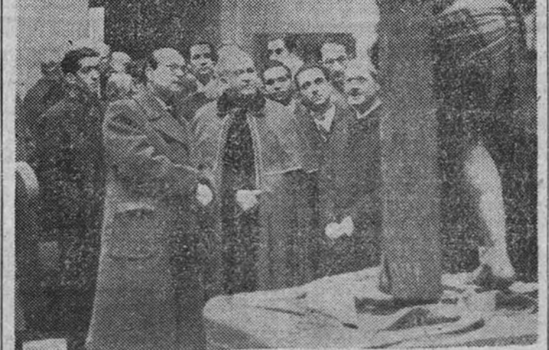
El Ministro de Educación Nacional inaugura la Exposición de Arte Religioso que se celebra en el Palacio de Exposiciones del Retiro

LONDRES 8 (3 m. Especial).—De acuerdo con las decisiones de Moscú, que en la parte relativa a Rumania imponían a este país la condición de ampliar la base de su Gobierno para que fuese reconocido por la Gran Bretaña y los Estados Unidos, el doctor Emil Hattiganu, representante del partido nacional campesino, y Mihail Romnice, del partido nacional liberal, prestaron juramento ante el Rey Miguel como ministros en el Gobierno del doctor Groza.