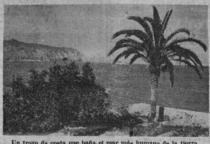
Un trozo de costa que baña el mar más humano de la tierra.