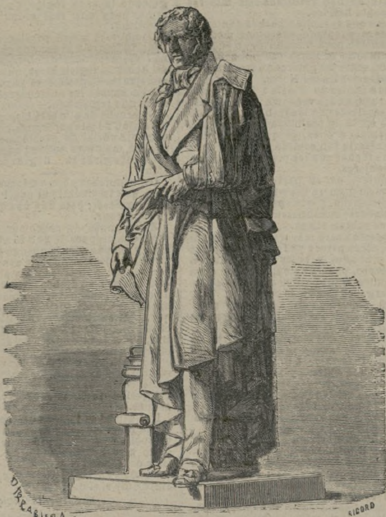
La estatua de Mendizabal.

Precios convencionales. Toda la correspondencia se dirigirá al ADMINISTRADOR DE EL GLOBO.