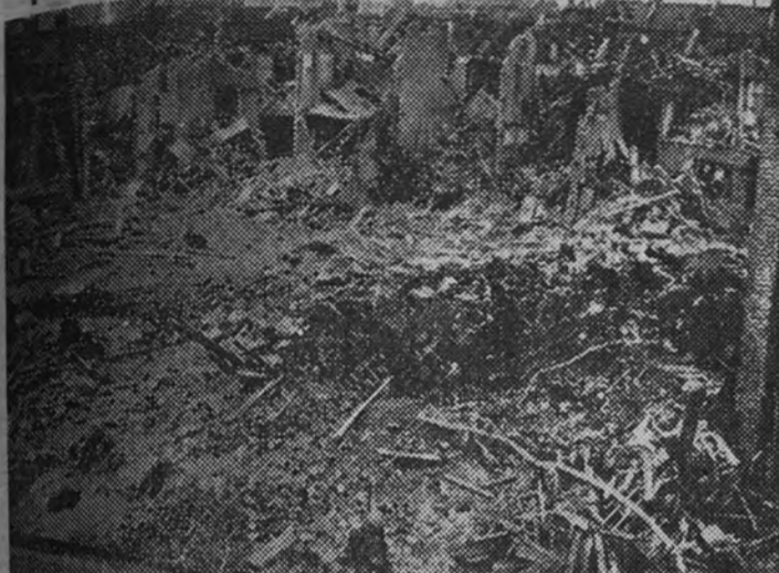
Efectos de un bombardeo aéreo

Lo confirman así las destrucciones que en pocas semanas de ataque sufrió el Japón