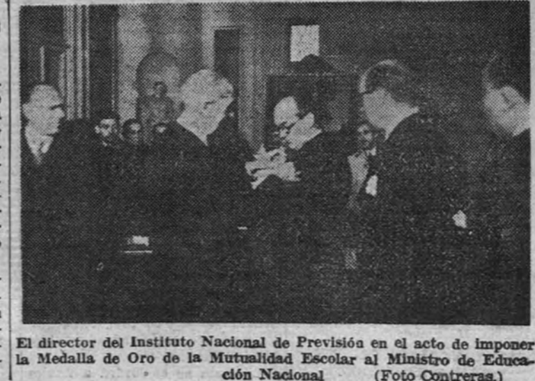
El director del Instituto Nacional de Previsión en el acto de imponer la Medalla de Oro de la Mutualidad Escolar al Ministro de Educación Nacional.