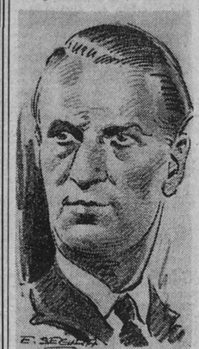
El duque de Hamilton

"Hoy más que nunca mi lealtad al Führer sigue siendo absoluta"