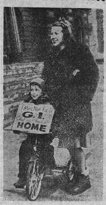
Este niño y su madre, que, debido a la escasez de casas en la ciudad de Detroit, se encuentran sin hogar, se pasean delante del Ayuntamiento de la ciudad con un letrero en que exponen la necesidad apremiante que tienen de encontrar un alojamiento.