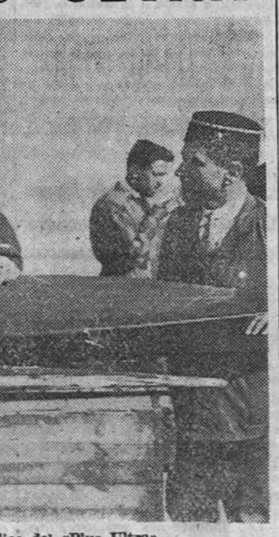
Ramón Franco y Julio Ruiz de Alda examinan la hélice del «Plus Ultra»

Hoy hace veinte años que el «Plus Ultra» salió de España para cubrir el primer gran vuelo sobre el Atlántico. Hace unos días ARriba dedicó una página a la conmemoración de esta hazaña de la Aviación española. Hoy, en nuestra quinta plana, insertamos un interesante trabajo de nuestro colaborador, el Coronel J. A. F., titulado «De cómo le fue arrebatado el trofeo internacional Harmon a la tripulación del «Plus Ultra», en el que relata unos curiosos pormenores hasta ahora casi inéditos.