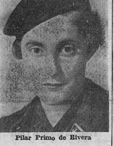
Pilar Primo de Rivera

La primera prueba de la bomba atómica en el mar se hará a primeros de mayo