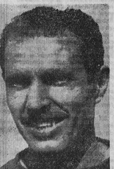
Arencibia y Jorge, que reaparecerán en la delantera del Atlético el próximo domingo en Barcelona

Esto ha animado a los del Atlético a ficharlos nuevamente por el Club patrio.