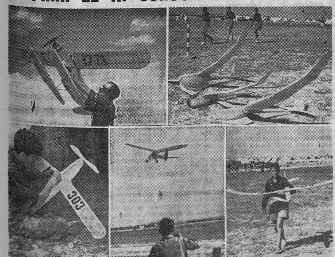
Ante el próximo III Concurso Nacional de Aeromodelismo los dos mil alumnos de las escuelas españolas preparan sus modelos para optar a los importantes premios que se conceden. Ofrecemos diversos aspectos de la construcción y ensayo de algunos modelos

Se aprecia una gran actividad entre los medios aeromodelistas con motivo de la preparación del III Concurso Nacional, que se celebrará el próximo mes de junio. Todas las Escuelas de Aeromodelismo—actualmente existen 27 en funcionamiento, con un total