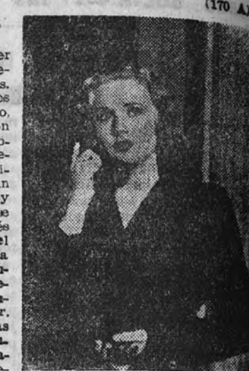
El lunes se estrenará en el Palacio de la Música "La dama del tren". Esta película presentada por Astoria, señala el mayor triunfo interpretativo de la bellísima "estrella" Diana Durbin.