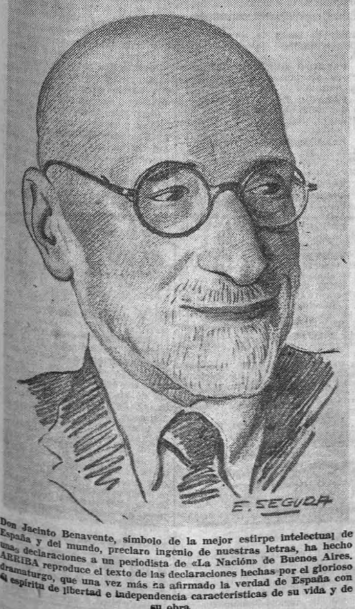
Don Jacinto Benavente, símbolo de la mejor estirpe intelectual de España y del mundo, preclaro ingenio de nuestras letras, ha hecho una declaración a un periodista de la Nación de Buenos Aires. ARriba reproduce el texto de las declaraciones hechas por el glorioso dramaturgo, que una vez más reafirma la verdad de España con la espíritu de libertad e independencia características de su vida y de su obra.

En cuanto al aspecto financiero del "modus-vivendi" se ha acordado un régimen de pagos de gran elasticidad y sencillez, para favorecer el intercambio comercial. Los servicios financieros que han centralizados en el Instituto Español de Moneda Extranjera y en el Nederlandsche Bank, de Amsterdam. El cambio del florín y de la peseta se ha fijado sobre la cotización en Amsterdam y Madrid del dólar norteamericano.