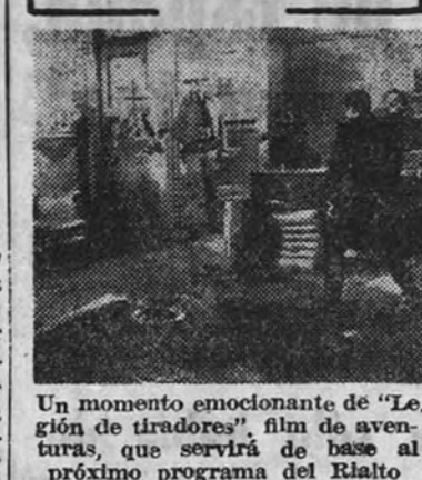
Un momento emocionante de "Legión de tiradores", film de aventuras, que servirá de base al próximo programa del Rialto.