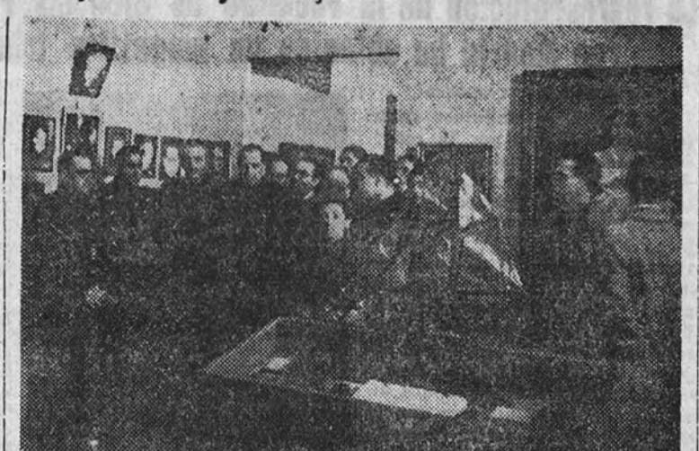
El Vicesecretario General del Movimiento y demás jerarquías concurrentes a la apertura de la Exposición Nacional de Arte del Frente de Juventudes, durante su visita a las instalaciones de este importante certamen juvenil.

En una sala figuran los trabajos de los alumnos becarios del S. E. U. de las Escuelas de Bellas Artes, con aportaciones importantes de Madrid, Sevilla, Tarragona y Barcelona, en su totalidad oleos destacando un retrato de excelente ejecución, que representa al Delegado Nacional del Frente de Juventudes, camarada José Antonio Elola.