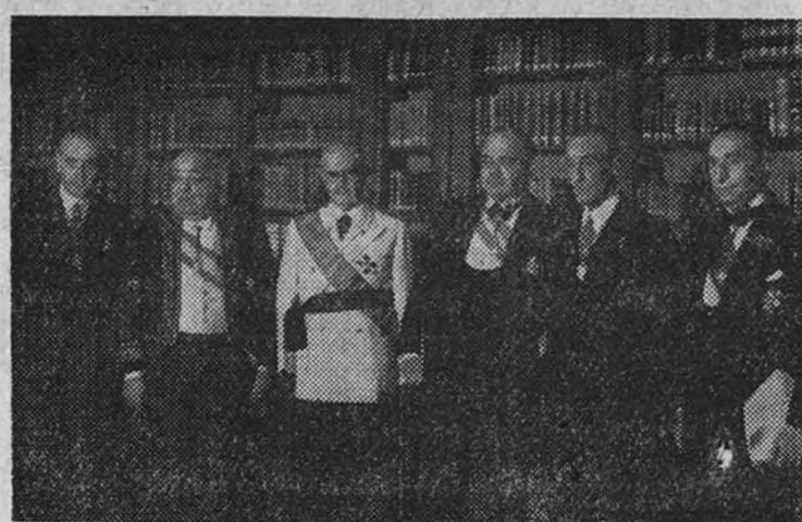
Personalidades que presidieron el solemne acto conmemorativo de Francisco de Vitoria celebrado ayer por el Instituto de España en la Real Academia Española