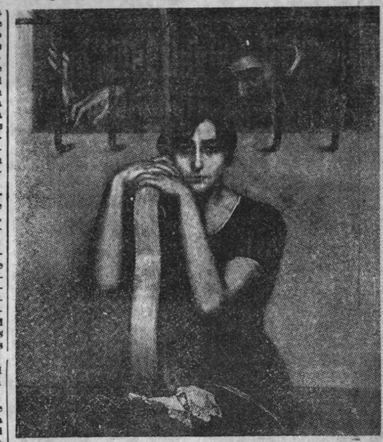
«Carcelera», una de las obras más características del genial Romero de Torres

«¿Y era falsificado? «No solamente eso, sino también otros cuatro que tenía allí. Se veía claramente que la firma era imitada. En cuanto a los te-