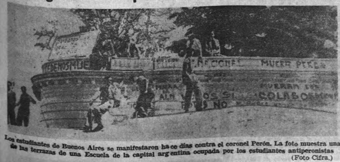
Los estudiantes de Buenos Aires se manifestaron hace días contra el coronel Perón. La foto muestra una de las terrazas de una Escuela de la capital argentina ocupada por los estudiantes antiperonistas.