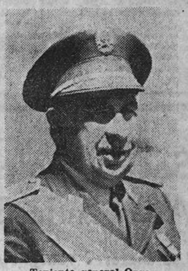
Teniente general Orgaz

El cadáver fue amortaljado con el hábito franciscano y depositado en la capilla ardiente, que se instaló en una de las habitaciones de la casa. Se celebraron en dicha capilla misas de "corpore insepulto", una de las cuales fue oída por el Ministro del Ejército, teniente general Dávila. Durante toda la mañana desfilaron por la casa mortuoria los Ministros; el Capitán General,