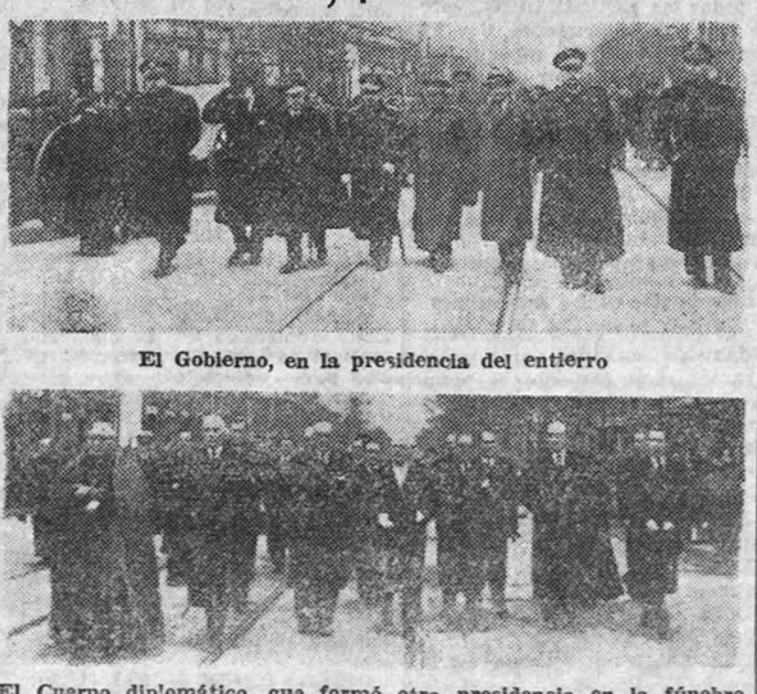
El Gobierno, en la presidencia del entierro

Un público numerosísimo presenció desde las aceras de las calles que recorrió la comitiva el desfile de ésta.