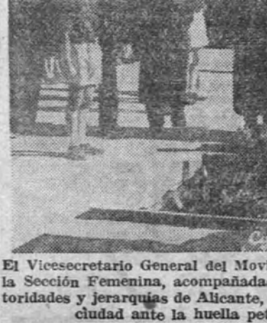
El vicepresidente General del Movimiento y la Delegada Nacional de la Sección Femenina, acompañadas de las congresistas y de las autoridades y jerarquías de Alicante, orando en el cementerio de aquella ciudad ante la huella petrificada de José Antonio