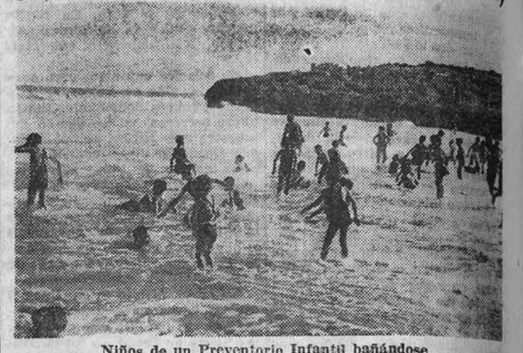
Niños de un Preventorio Infantil bañándose

—Las Colonias para niños de familias tuberculosas pobres se iniciaron en nuestra Patria hacia los años 1908-1910, siendo las primeras las de Pedrosa (Santander) y Oza (La Coruña), organizadas por el Real Patronato de la Lucha Antituberculosa. Después, bien por parte del Estado, bien por organismos provinciales, con objeto de sustraer a los muchachos débiles de las clases más