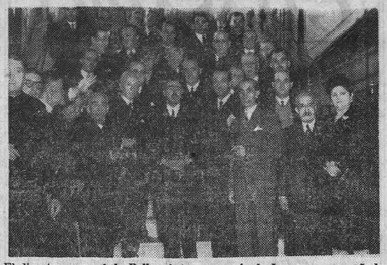
El director general de Bellas Artes, marqués de Lozoya, acompañado de representantes del mundo del arte y de las letras, durante el homenaje de que fue objeto a mediodía de ayer

Ayer se celebró en el Círculo de Bellas Artes el homenaje organizado por la Asociación de Pintores y Escultores en honor del marqués de Lozoya, director general de Bellas Artes.