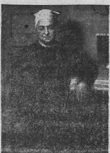
Retrato, óleo del pintor E. Salaverría que figuró en el XIX Salón de Otoño

FILATELIA PARTICULAR paga más que nadie lotes colecciones. Valero Larra, 14.