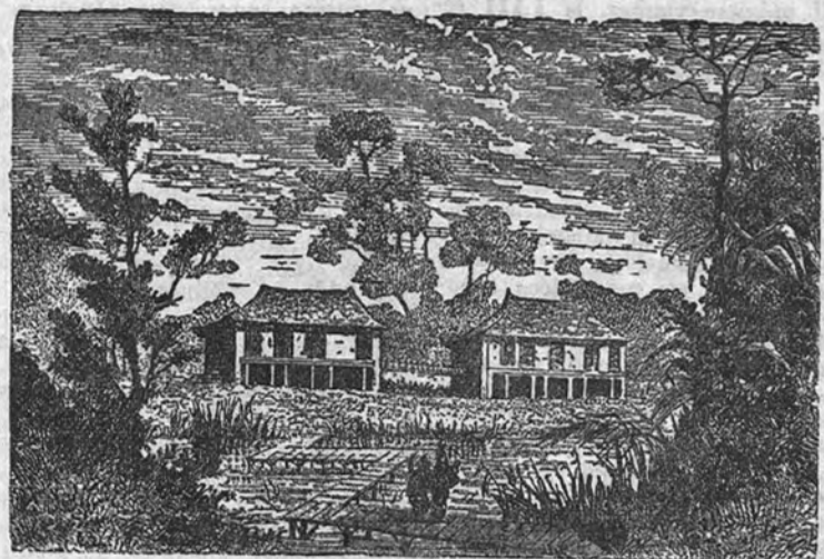
El jardín y el gimnasio del Palacio Imperial de Kyoto. (Apunte del libro «Paseo alrededor del globo» del barón de Hubner, año 1871)

(Servicio especial para ARRIBA.) TOKIO 4.—La suerte futura del Emperador del Japón preocupa tan seriamente a ciertos sectores de la opinión japonesa, que ha empezado a pensarse seriamente en abandonar definitivamente su residencia habitual de la capital nipona para trasladarse con su Corte a Kyoto, donde se encuentran otros de los muchos palacios imperiales. Entre la clase media japonesa—la más apegada a los valores tradicionales y la que probablemente conserva más incommovible su fe y su lealtad por el Emperador—se ha organizado un movimiento en favor de este traslado, que se pretende justificar con la necesidad de que el Jefe del Estado permanezca apartado de la agitación de la etapa política que se inicia en el país y que culmina con la celebración de las elecciones generales, fijadas ya con carácter definitivo para el 31 de marzo próximo por el Gobierno. Se pretende con este movimiento—que ha encontrado un decidido apoyo por parte de un sector de la alta aristocracia nipona—devolver al Emperador su histórica representación, de carácter puramente representativo, con visos de religiosidad, perdida desde el advenimiento del Emperador Meiji, el primero en intervenir personalmente en la dirección de la política del Estado. Precisamente por ello es por lo que las autoridades aliadas, así como la