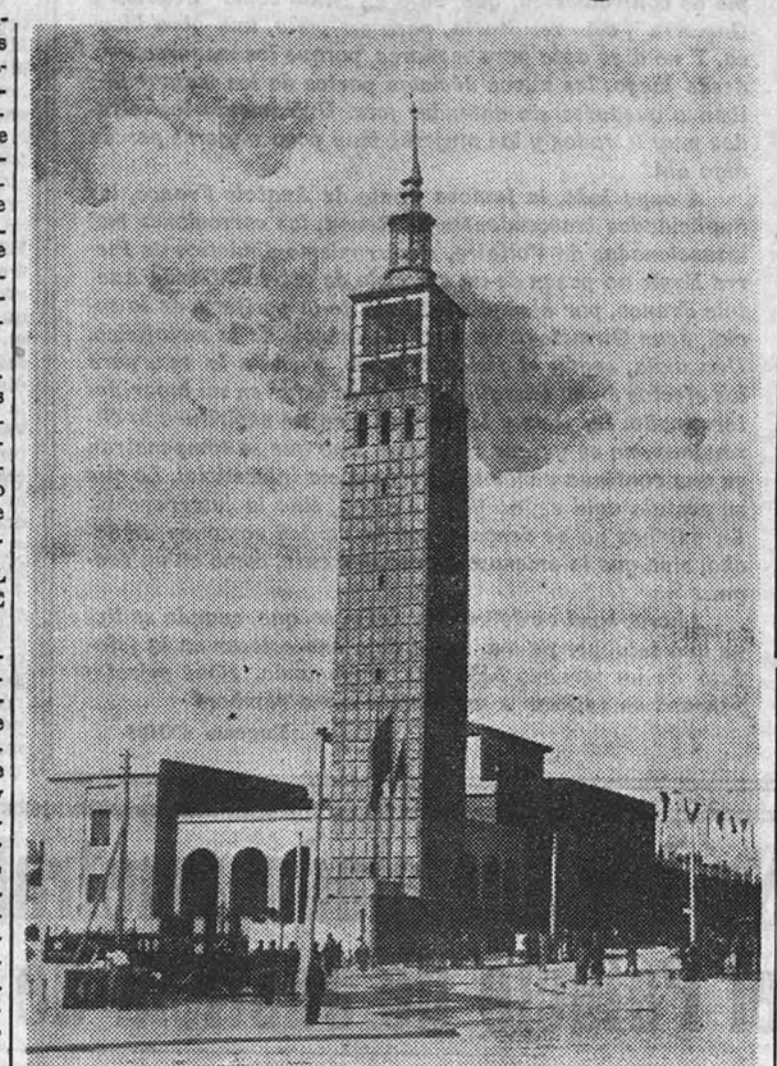
Un aspecto del recinto de la Feria de Muestras de Zaragoza

—¿Naturalmente, la VI Feria, o sea la de 1946, se abrirá el 30 de septiembre, hasta el 15 de octubre, como todos los años.