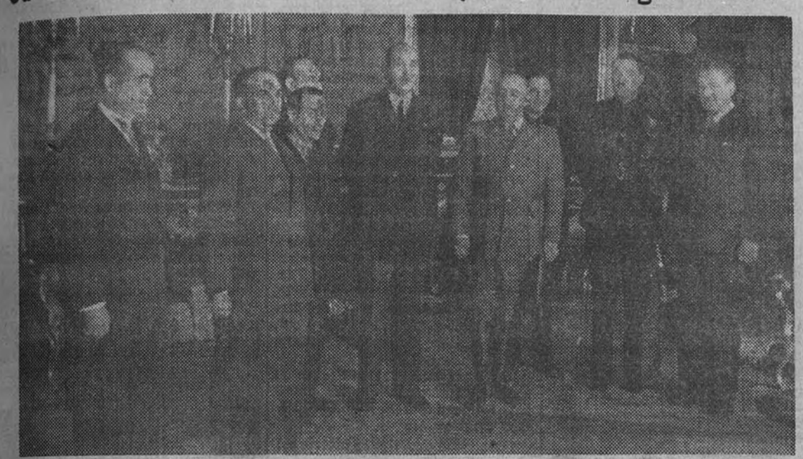
El Caudillo recibe al Consejo Directivo de la Federación de las Asociaciones de la Prensa, que le entregaron los mensajes de adhesión de los periodistas españoles.