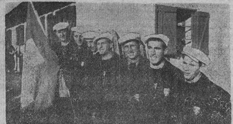
El equipo suizo de esquí, que ha vencido en la semana internacional de La Molina