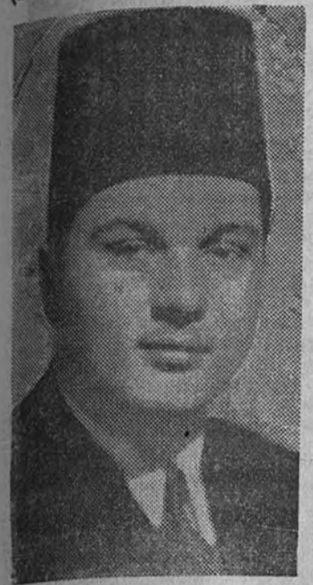
Faruk de Egipto