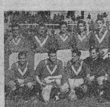
La selección castellana de balón a mano, que jugó ya contra Guipúzcoa, y que, con muy ligeras variaciones, repetirá el encuentro en San Sebastián

—Mucho más, y no solamente es eso. Aunque el balón a mano se jugaba desde hace muchos años fuera de España y sólo seriamente desde hace dos en nuestra Patria, debido a la falta de competiciones con otros países no habíamos llegado a comprender dónde residía la mayor efectividad del juego.