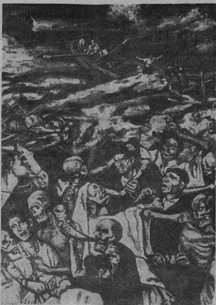
«El fin del mundo» (fragmento), por Gutiérrez Solana

Con ello han pasado inadvertidos los esfuerzos del pintor por afianzarse en su arte, sus problemas y las causas que han motivado su vivo proceso. Sin embargo, no es posible explicarse esta producción ardorosa y fantástica, traspasada de luz y teñida de rutilantes colores, sin recordar su espléndido conjunto de 1929, en esta misma sala del Museo de Arte Moderno, y el de dos años antes, apenas apreciados entonces, donde se habían superado las primeras dificultades expresivas. Aquella labor extraordinaria era la preparación de esta madurez fogosa y sintética de última hora, en que la maestría suple eficientemente, en ciertos momentos la imposibilidad física. Tal vez razones de tipo estético activaron el cambio de paleta, desde la entonación un tanto monótona hasta la más cuidada polítona. Hace unos años Solana nos confesaba que estaba harto de oír hablar de su «paleta negra», y que iba a emplear colores vivos y enteros. El color no llegó, de todas formas, a tener un alto valor expresivo en sus últimas obras; sirvió para acentuar la nota realista y la visibilidad del tema, sin subrayar el carácter. Sobre la base negra del contorno los tonos se sostienen o realzan, como en la pintura de Zuloaga, para evidenciar lo corpóreo, el sentimiento vigoroso de la calidad. Los encendidos colores, cada vez más acusados en la tendencia clara, no se funden, generalmente, en sus cuadros.