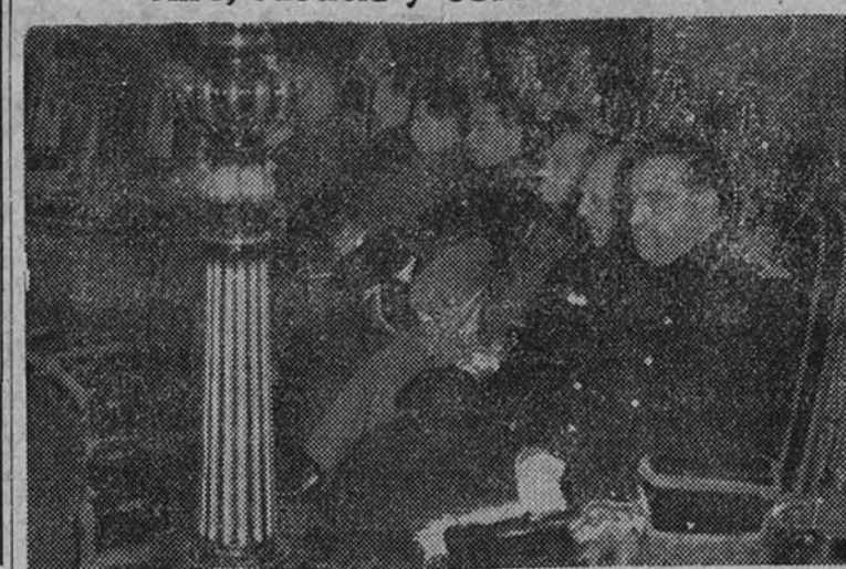
Los Ministros, en la presidencia de los funerales

Con el teniente general Dávila presidieron los Ministros de Asuntos Exteriores, Marina, Aire, Justicia y Obras Públicas