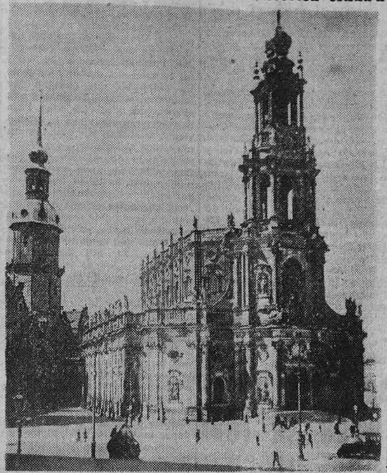
La catedral de Dresde

Puede considerarse recuperada en un 30 por 100 la anterior capacidad industrial de la ciudad, exceptuando la producción de guerra, abolida hoy totalmente en Alemania. Ciento noventa y tres mil obreros y empleados continúan el censo laboral de Dresde, con oferta oficial de trabajo para todos ellos. La dificultad mayor que la industria tropieza hoy día—además a la quimérica falta del resurgimiento—, padeciendo marzo.