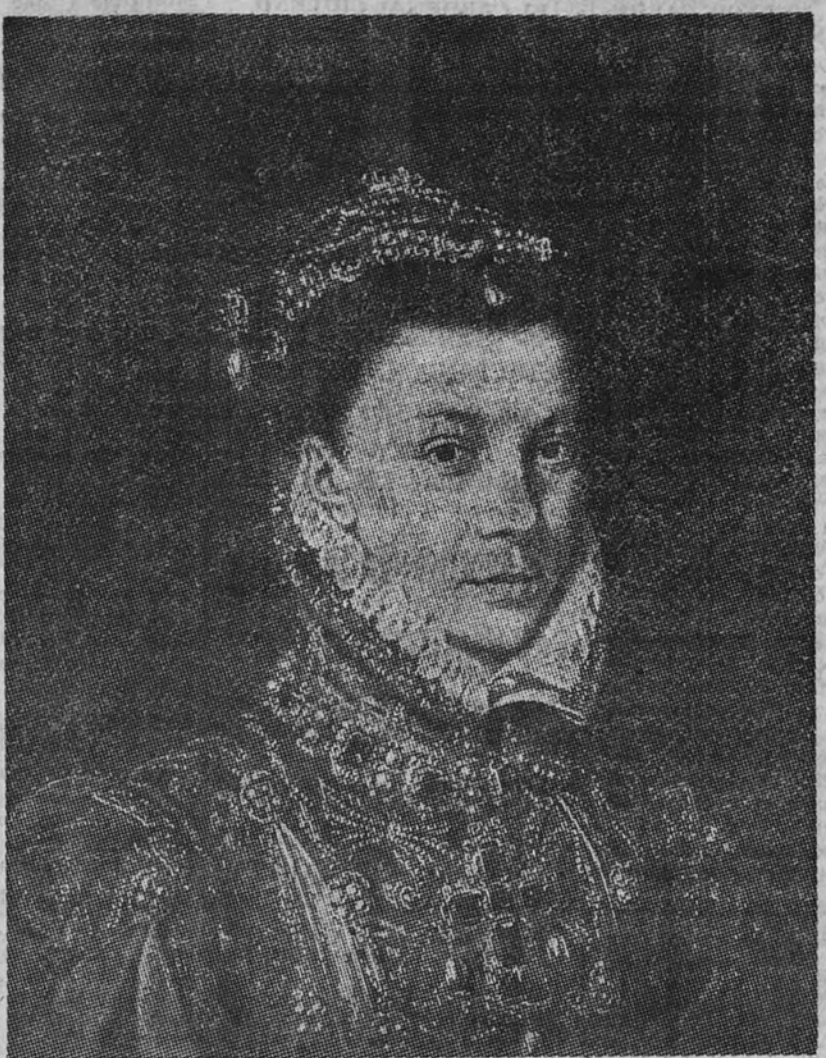
«Retrato», por Sánchez Coello