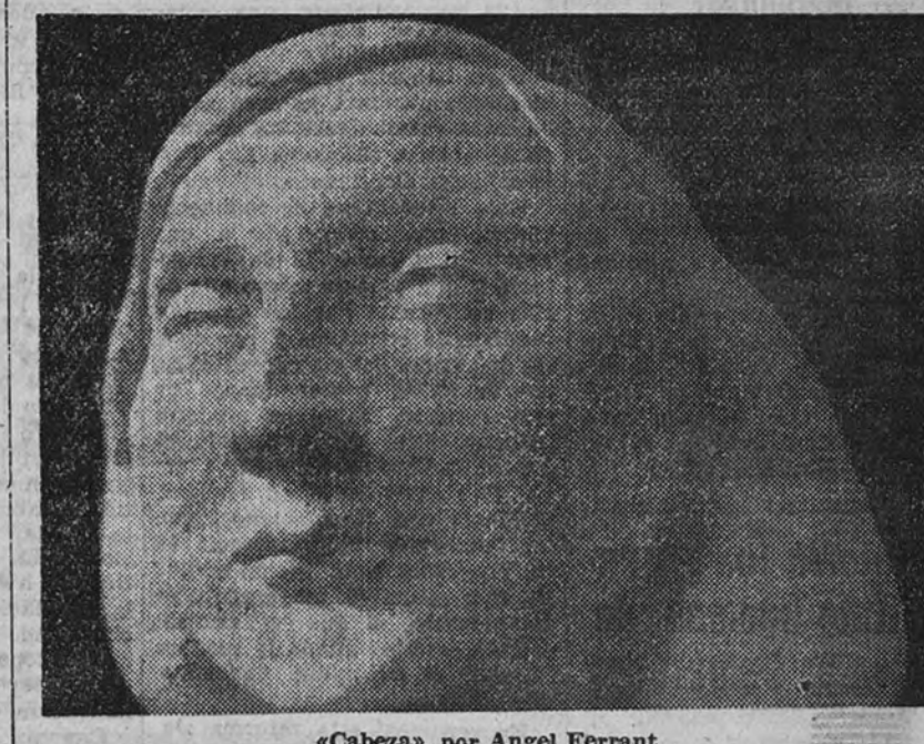
«Cabeza», por Angel Ferrant

Volviendo al hallazgo, y seguidamente al acto de su aprehensión, yo creo que es un hecho, sencillamente un hecho, tan simple y tan maravilloso, que no es necesario explicar, y que en el saber «aprehender» está la creación.