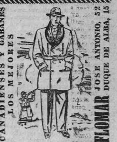
FLORAR DUQUE DE ALBA

En la segunda parte los portugueses presionaron, obligando al equipo inglés a jugar con más rapidez. El dominio fue a menudo, y un fuera de juego impidió que los portugueses atacasen victoriosos. Peyroteo consiguió el gol que fue anulado. (Mencheta).