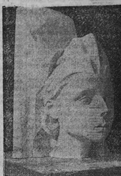
Escultura de Angel Ferrant

Por eso, cuando se le pide a Angel Ferrant que explique lo que hace o lo que ha querido hacer, habla casi indefectiblemente «de lo que se ha encontrado» y él ha «aprehendido». Diríase la alegría del primer hombre con la primera piedra de chocolate, para sus ojos, en la mano; con la primera piedra recogida que deseaba guardar, y, por lo tanto, no sol-