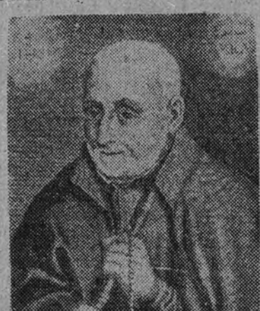
Beato Bernardino Realino

voluntad divina quiso sellar el ministerio del santo varón con el carisma de los milagros; de muchos de los cuales se hizo ilustración posteriormente. Por todo esto se difundió tal fama de santidad, que ha atraído de apartadas ciudades afluyen las gentes para visitar al "Santo de Lecce", como le denominaban. Cuando su muerte estuvo próxima, todo el pueblo se agolpó en torno a su lecho, besando sus manos y rogándole sus bendiciones y su protección para ellos y para sus hijos. El sudeño de la ciudad, Segismundo Rapana, en unión de los magistrados de Lecce se posó a sus pies impetrando su protección. Murió el día 27 de julio de 1616. En vida había compuesto, en latín e italiano, algunas poesías, pequeños tratados y comentarios literarios y filosóficos. Fue beatificado por el Papa León XIII el 27 de septiembre de 1895.