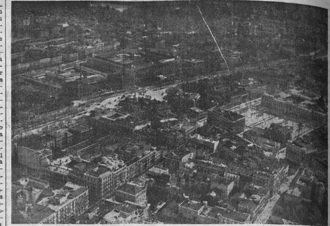
La zona del paseo de Recoletos y plaza de Colón vistas desde el avión

Transportaron 61.000 viajeros sin un solo accidente y con una regularidad de viajes del noventa y nueve por ciento