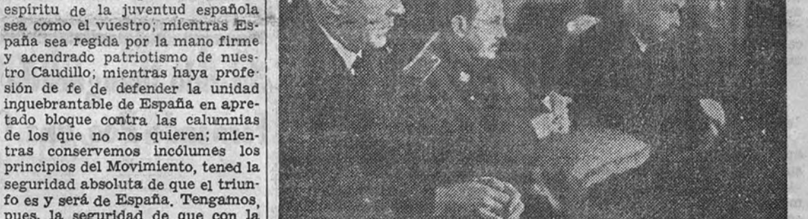
El Ministro del Ejército, teniente general Dávila, preside la misa celebrada para conmemorar las bodas de oro de la segunda promoción de Infantería.

Los actos fueron presididos por el Ministro del Ejército, teniente general Dávila