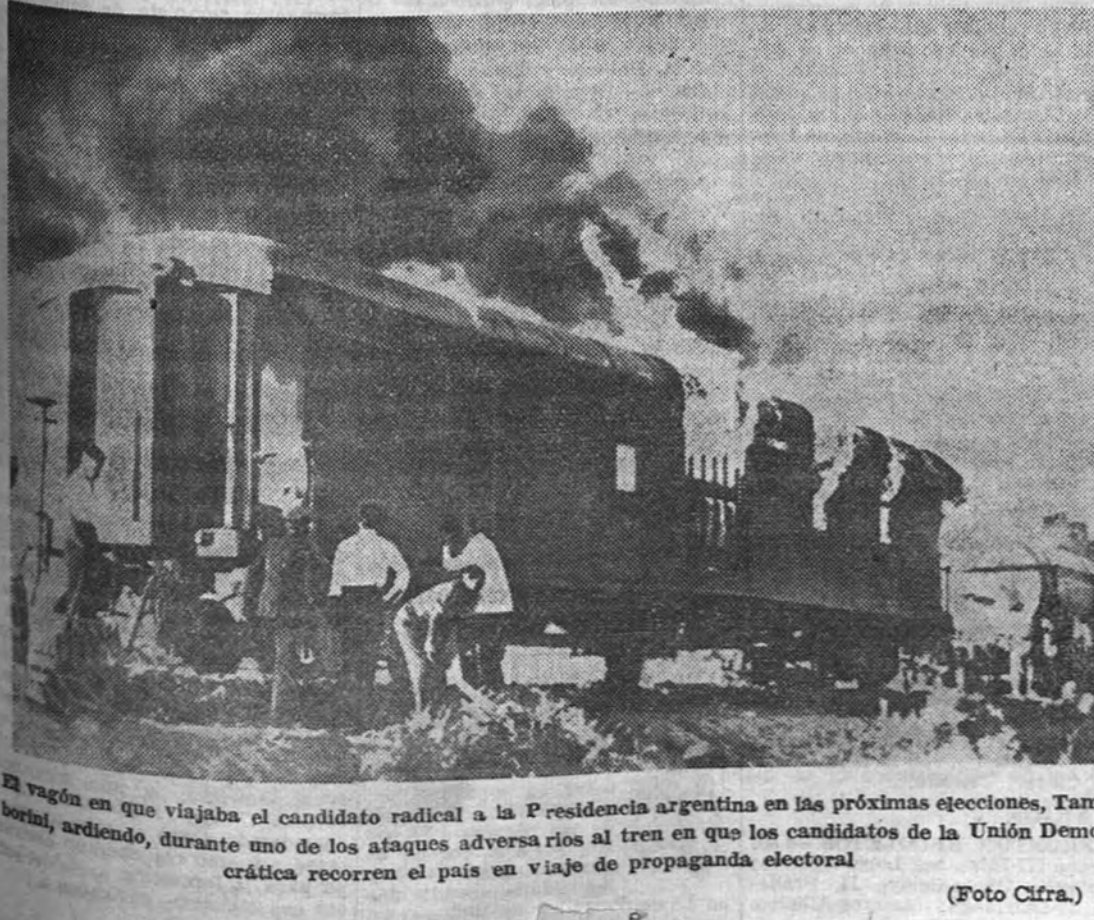
El vagón en que viajaba el candidato radical a la Presidencia argentina en las próximas elecciones, Tambo, ardiendo, durante uno de los ataques adversarios al tren en que los candidatos de la Unión Democrática recorren el país en viaje de propaganda electoral