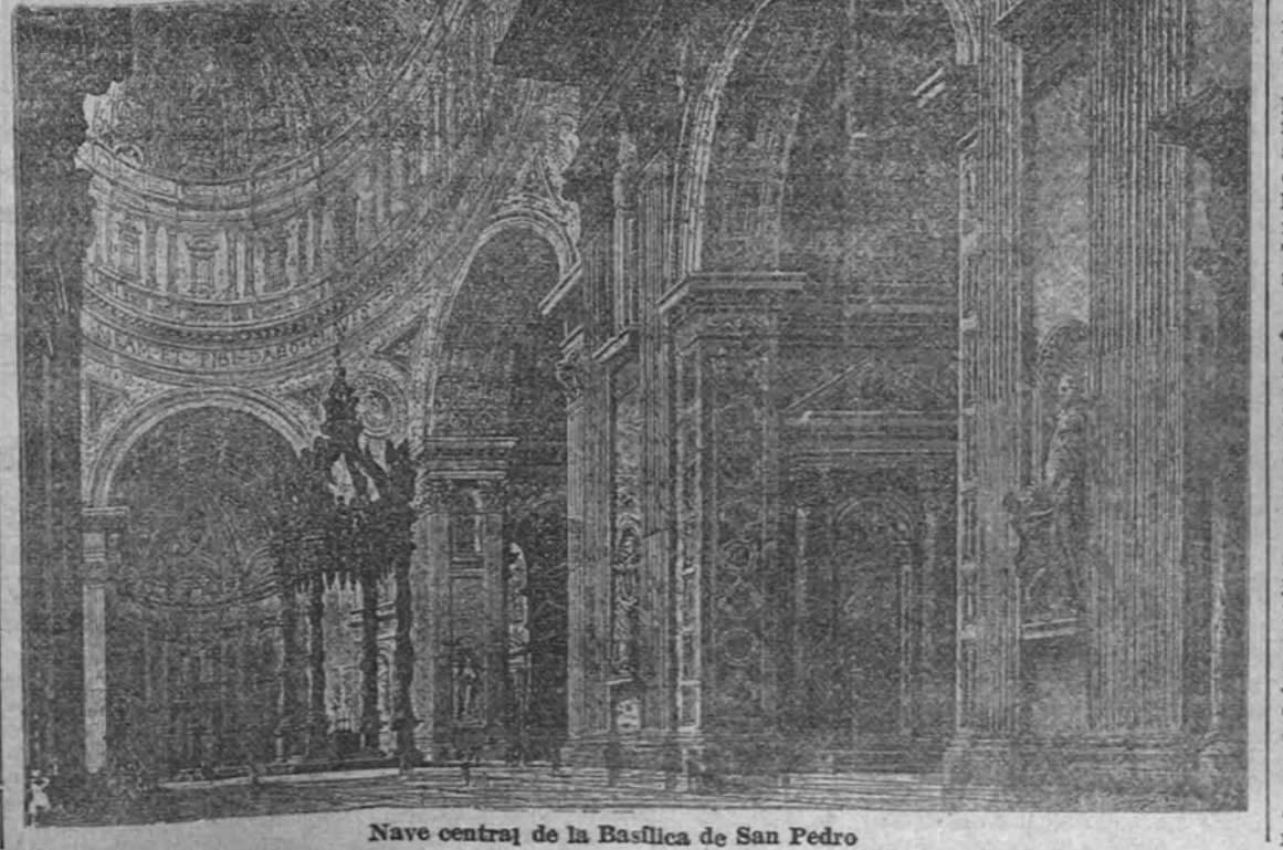
Nave central de la Basílica de San Pedro