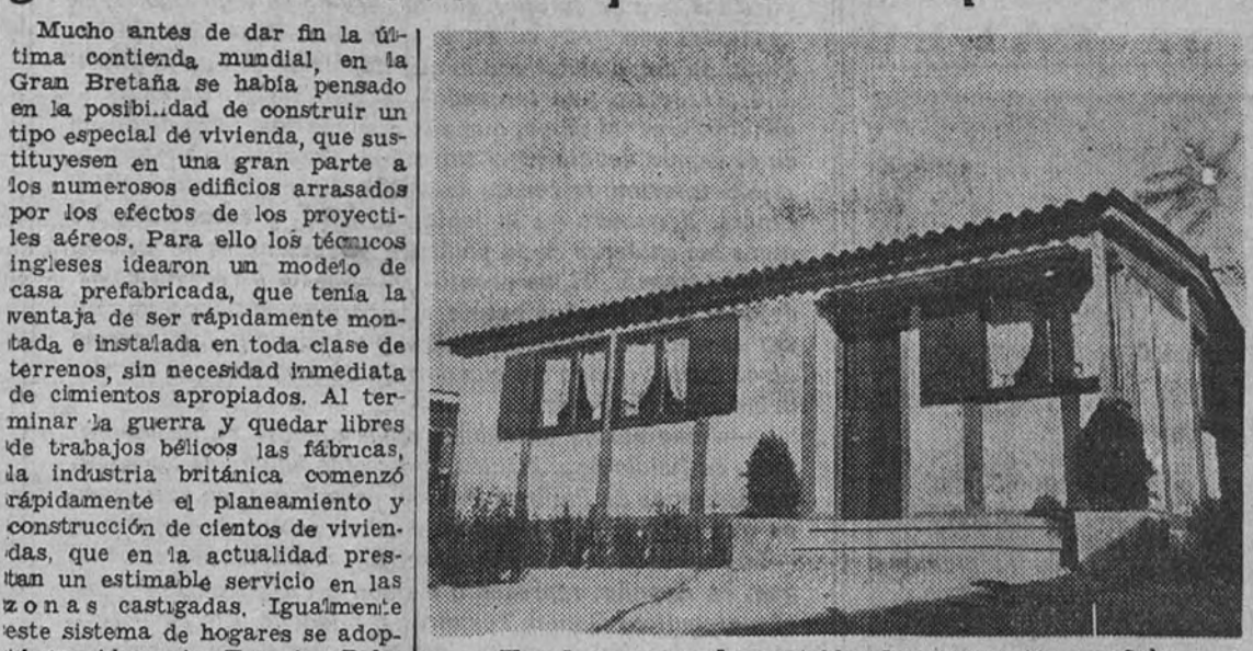
Una de las casas desmontables de construcción española

Los nuevos modelos son muy resistentes y pueden asegurar el confort de cualquier casa de tipo corriente