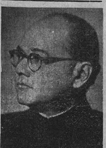
Subhas Chandra Bose

Gandhi, con su aspecto físico, sus ayunos, sus mortificaciones, da al movimiento la mística necesaria a esta clase de situaciones, y así, aunque los jefes de una aspiración nacional se multiplican, él queda como figura representativa, la más venerada por todos sus partidarios. En 1914 se funda, por Gokhale, el Partido Nacionalista Indio, al cual se adhirió Gandhi. El estallido de la guerra en Europa y las