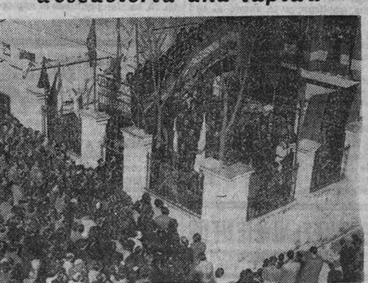
Un aspecto del acto religioso celebrado el domingo en la Subdelegación de F. E. T. y de las J. O. N. S. de Chamberí en memoria de los dos camaradas que murieron asesinados hace un año en dicho lugar

En el lugar donde cayeron fué descubierta una lápida