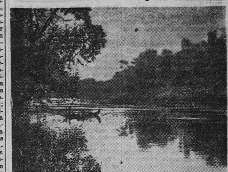
"Mañana de plata" (rio Benito), por Núñez Losada