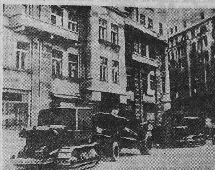
Carros rusos patrullan por Varsovia