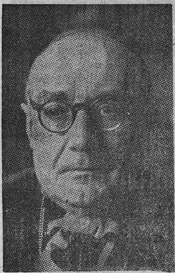
S. E. el Cardenal Primado

mundial, que tantos estragos, tantos odios y tantas ruinas ha causado, este Consistorio presenta ante el mundo el espectáculo de lo que es el reino de Cristo en la tierra: reino de justicia, de paz y de amor, reino de la verdad sobre la mentira y del amor sobre el odio.