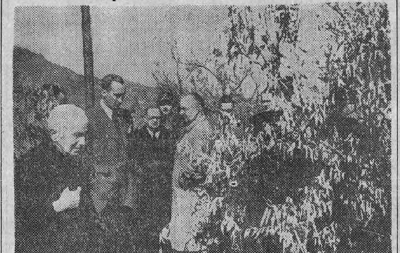
El señor Rein visita la zona naranjera de Sagunto, notablemente afectada por las últimas nevadas. Lo acompañan los ingenieros del Distrito Forestal

Una gran manifestación recorrió las calles de la ciudad vitoreando a España y al Caudillo