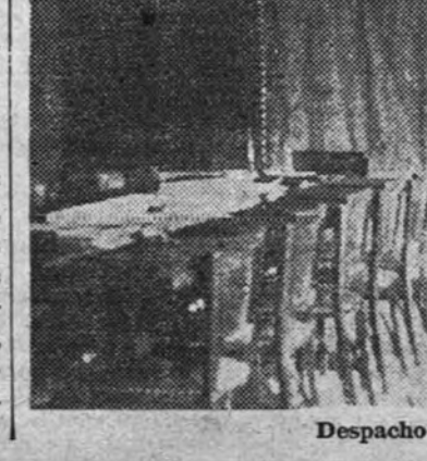
Despacho del jefe