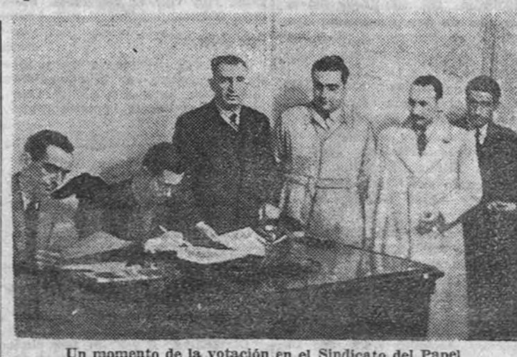
Un momento de la votación en el Sindicato del Papel

Añadidos dichos informes que los amotinados gritaron también: "¡Abajo Thorez!" (vice primer ministro comunista), trunfaron en la Redacción del periódico comunista, interrumpieron los muebles y quemaron los libros en la calle. (Efe.)