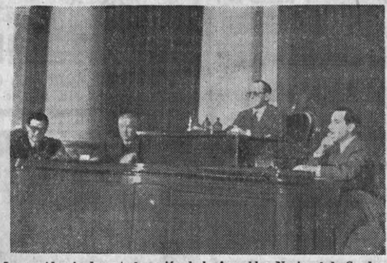
La presidencia durante la sesión de la Asamblea Nacional de Graduados en que se discutió la ponencia sobre periodismo

Se celebrará hoy, a las doce de la mañana, en el Palacio del Senado