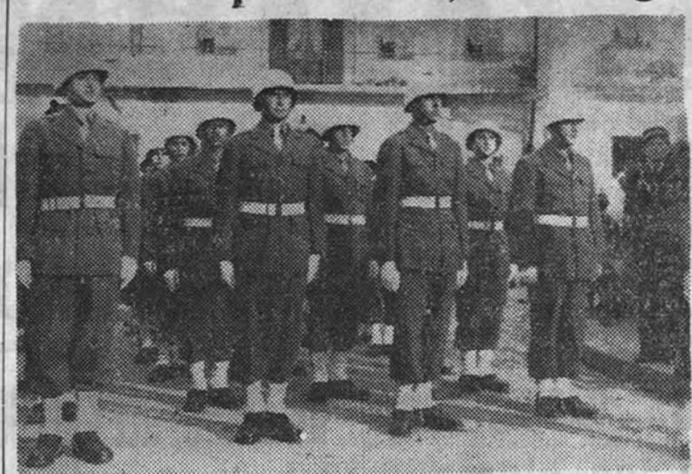
Estos nuevos agentes—la mayoría musulmanes y españoles—han comenzado a prestar servicio en la zona de Tánger. El uniforme es muy parecido al de la "Military Police" americana.

"Estamos resueltos a obrar para impedir la agresión"