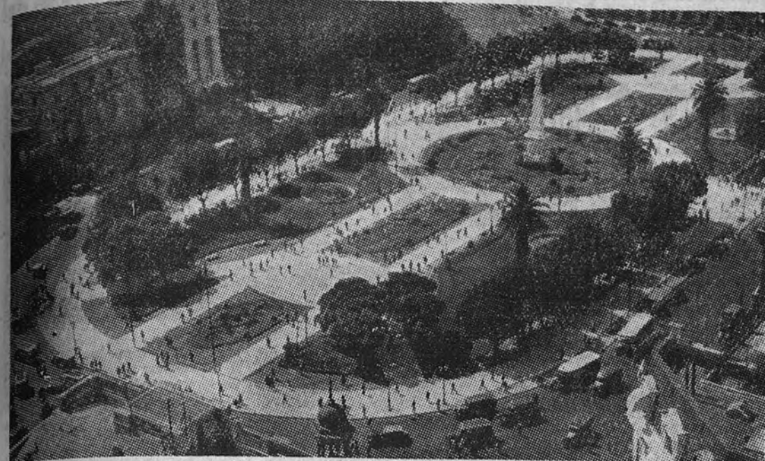
Plaza de Mayo en Buenos Aires

Existen quince mil escuelas primarias oficiales