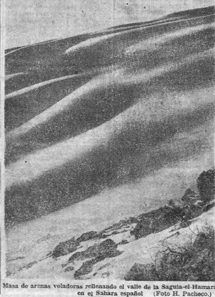
Masa de arenas voladoras relleno del valle de la Sagula-el-Hamra, en el Sahara español.