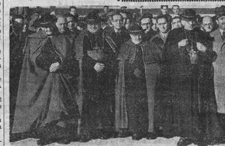
Los nuevos cardenales, a su llegada al aeropuerto de Barajas

(AMPLIA INFORMACION DE LA LLEGADA DE LOS CARDENALES, EN SEXTA PAGINA)