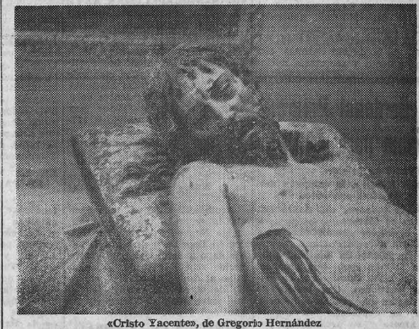
«Cristo Yacente», de Gregorio Hernández

De tales experiencias se puede partir, sin embargo, a la consecución de un nuevo arte religioso, con la mera incorporación de los hallazgos plásticos a una más honda y céntrica expresividad movida por el espíritu creyente. La contribución del postimpresionismo al arte religioso se ha limitado, dentro de las normas de cada grupo, a una serie de intentos dirigidos primordialmente a satisfacer las demandas de la sensibilidad. Ni el expresionismo elemental de Rouault; ni la fosca y patética representación de Desvallières; ni las seráficas visiones de Denis, harían ingenuas, por ejemplo, pueden colmar las exigencias espirituales y estéticas del hombre actual.