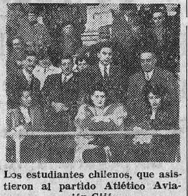
Los estudiantes chilenos, que asis-tieron al partido Atlético Aviación-Gijón

Después de este gol el partido revivió un poco, adquiriendo to-nalidades emocionantes, tanto o porque volvió el brío como porque