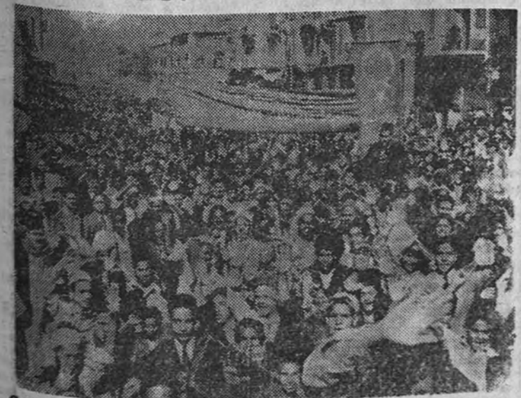
Cabeza de una de las manifestaciones que como protesta contra la permanencia de tropas británicas en el país organizó la juventud egipcia, a su llegada a la plaza de la Opera de la capital