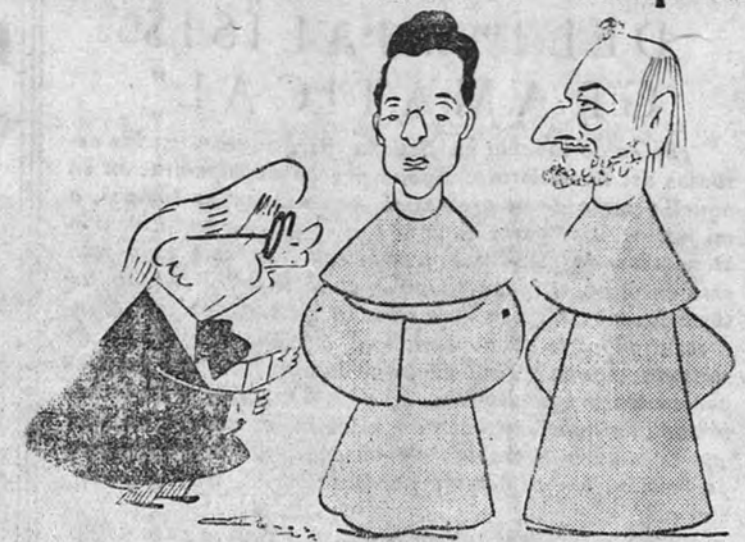
Marquina, Seoane y Rivero

El domingo por la noche se puso en escena «El monje blanco», del ilustre poeta Eduardo Marquina.