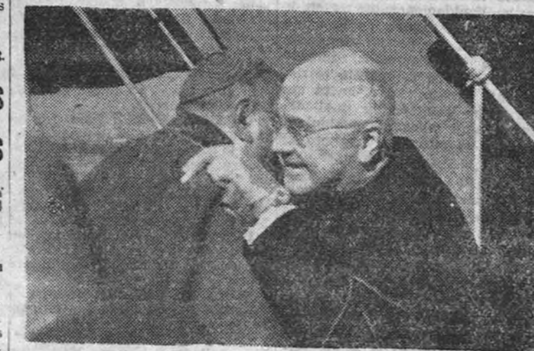
El cardenal norteamericano abraza a los obispos que acudieron a recibirle