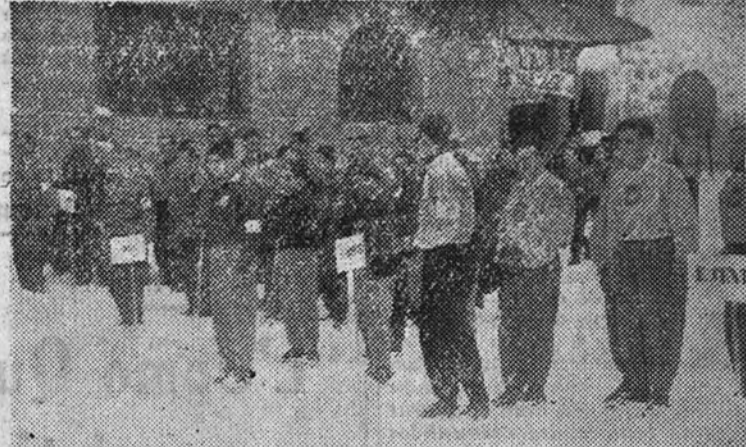
Formación de los equipos participantes en los Campeonatos nacionales de esquí. De izquierda a derecha: Cataluña, Andalucía, Norte y Centro

Con la prueba de relevos co-mienzan en realidad los Campeo-natos, dedicándose entre tanto to-