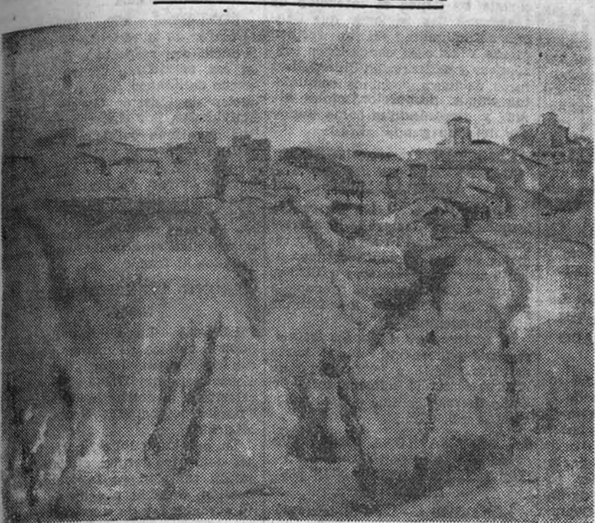
Óleo de Eduardo Vicente

A poesía—como una ola ligera—mente tibia—tibia, todos los años durante una quincena, al tiempo de colgar Eduardo Vicente su submundo: la poesía de la pintura, ese estremecimiento que no basta, quizás, pero que vivifica y llena los seres y sus cosas de alegría y de fecundidad. Del paraíso de los golfos—aquél país donde el hambre silba como una serpiente—viene, plácidamente, con paso tan lento—o velocísimo—como seguro—que eso es la precisión—una gama ensombrecida sin tormento, velada sin fricción, casi con rubor, y que nos desata esa soterrada cuerda del alma que, a veces, duerme, empujándose, bajo el corazón que espera—Dios sabe qué—eternamente.