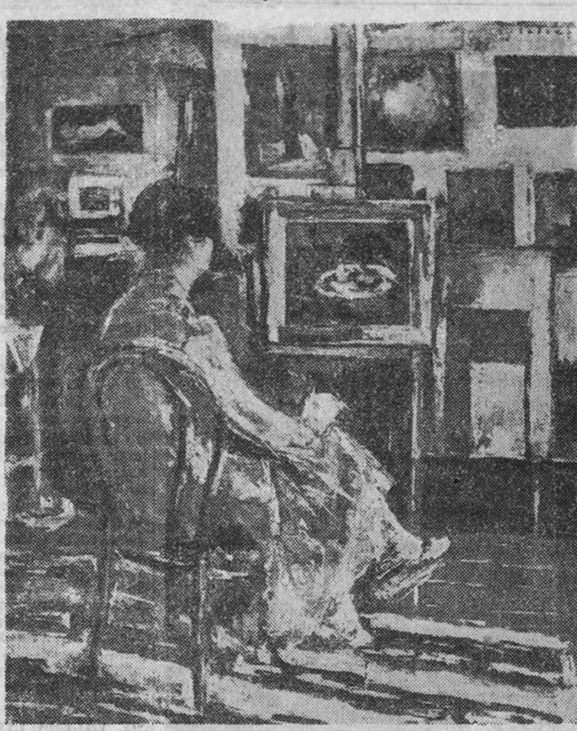
«Interior», por Petrascu

reducida de los cuadros de Petrascu y el volver frecuente a unos temas preferidos por el artista. Pues un paisaje marino, un invierno o un interior de taller, y no menos un objeto de naturaleza muerta, una bandeja con manzanas, una mesa con libros, un jarro de cobre sobre un tejido de colores, representa, para este modo de considerar y reproducir las cosas, temas inagotables, existencias