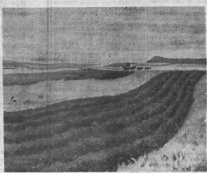
«Paisaje castellano», por Vaquero