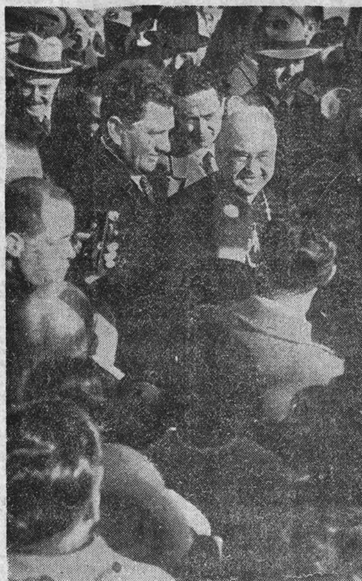
El cardenal Spellman, rodeado por la multitud en las calles madrileñas.

vo Sotelo y Prado, desbordó su entusiasmo con vivas al Papa y al Caudillo, y aplausos al cardenal, de manera incesante. Monseñor Spellman, acompañado del Nuncio, se dirigió a pie entre la muchedumbre; pero llegó un instante en que la aglomeración era tal que no podía dar un paso, y, lentamente, en automóvil, pudo avanzar por el paseo del Prado, dirigiéndose a la Nunciatura, agitando de los aplausos del gentío que aclamaba sin cesar al representante de los católicos norteamericanos.