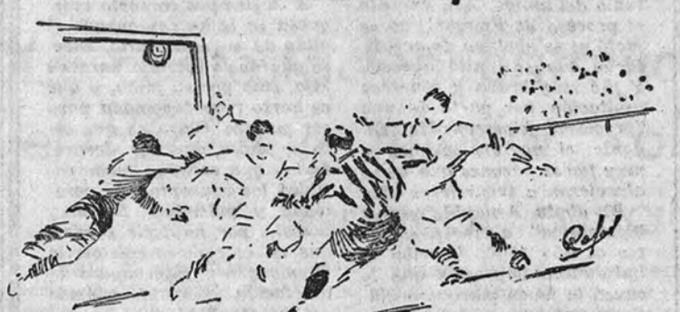
Arenchibia recoge en difícil postura un rechace flojo y consigue el primer tanto del Aviación.

se hizo un fútbol mejor. Pero el Gijón acabó desfondándose de nuevo hasta no existir en el cam-po más que un conjunto: el ma-drileño. Pero tampoco su delan-tera forzó demasiado las cosas y el 2-0 se mantuvo hasta el final.