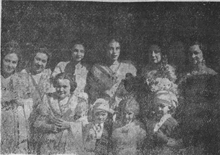
La fallera mayor, rodeada de su corte, durante el acto celebrado en el teatro Rialto