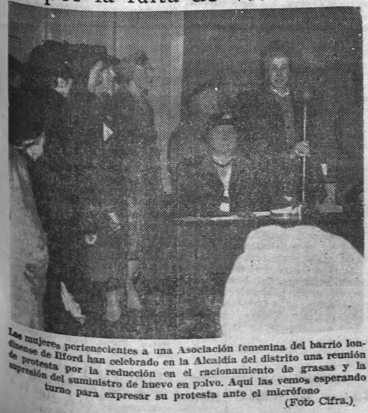
Las mujeres pertenecientes a una Asociación femenina del barrio londinense de Holford han celebrado en la Alcaidía del distrito una reunión de protesta por la reducción en el racionamiento de grasas y la supresión del suministro de huevo en polvo. Aquí las vemos esperando turno para expresar su protesta ante el micrófono.