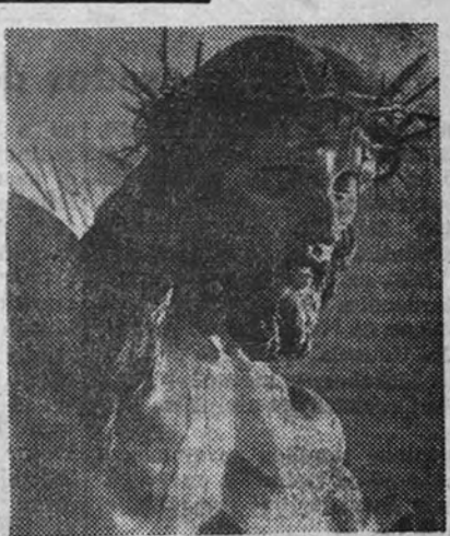
«Cristo Crucificado» (fragmento), por José Planes

Aquellas tendencias que en nuestro país permanecen vinculadas a la tradición a través del normativismo académico, se hallan en condiciones de asimilar los elementos expresivos fundamentales de nuestro gran arte religioso, como iniciación idéntica y conceptual para una expresión independiente y representativa de la época. Mientras el artista adscrito a un nuevo realismo no halla en la propia inspiración o en las sugestiones del ambiente los estímulos precisos para una interpretación elevada capaz de constituir una verdadera aportación icónica, le es, al menos, indispensable esta directiva referencial de los más nobles ejemplos. La continuidad se hace además inevitable en la esfera de lo