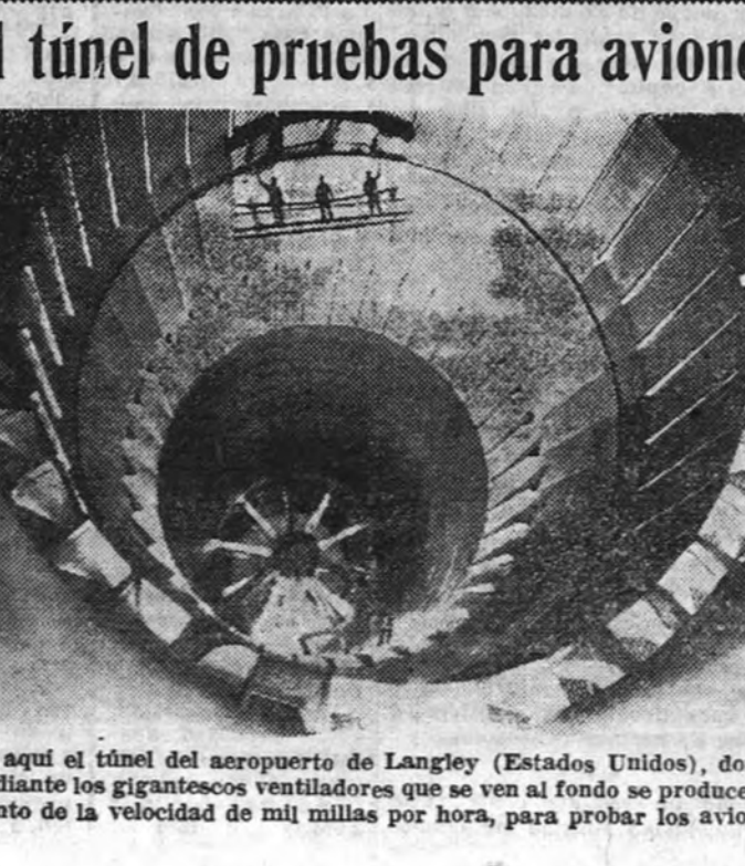
He aquí el túnel del aeropuerto de Langley (Estados Unidos), donde mediante los gigantescos ventiladores que se ven al fondo se produce un viento de la velocidad de mil millas por hora, para probar los aviones

Contra las enfermedades de la piel y cuero cabelludo, eczemas, erupciones y granos. Suprime el picor. Censura Sanitaria núm. 1.122